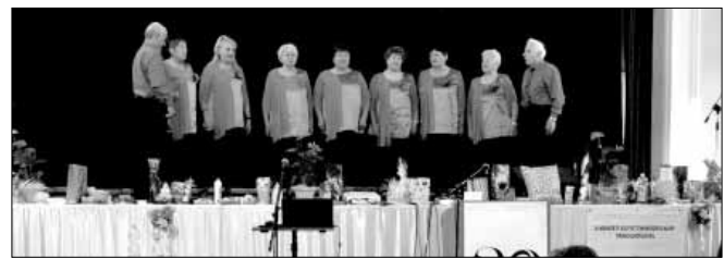
Fellépet az egyesület ének- és táncosportja

Programok: - Kézműves tevékenységek, adventi, karácsonyi díszek készítése - Tombola, büfé Támogató jegy: Gyermekeknek: 150 Ft Felnőtteknek: 300 Ft A Szalontai Úti Tagóvoda dolgozói