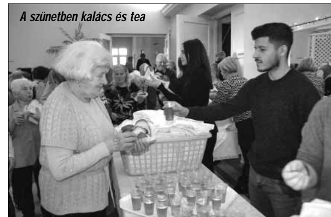
A szünetben kalács és tea