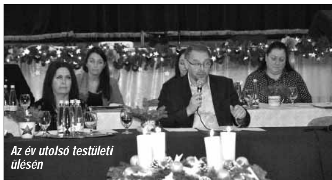
Az év utolsó testületi ülésén