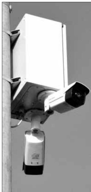
Újabb 7 db kamerával bővül a városi térfelügyelő kamerarendszer

vezető rendszer kiépítése fog megtörténni a meglévő nyílt árok nyomvonalában. A Vasút utca 16. szám alatti volt Tüdőgondozó épületéből a soft elemek megvalósításához egy 225,59 m 2 -es akadálymentes közösségi ház kerül kialakításra, melyhez 1.016 m 2 zöldterület felújítás is kapcsolódik. A közbiztonság javítása és a bűncselekmények megelőzése érdekében további 7 db kamerából álló térfelügyelő kamerarendszer kerül kiépítésre a Magyar, a Munkás, a Széles és a Hajdú utcán, a Szent István téren, a Vértanúk tere - Vár u. sarkán és a Hajdú u. - Losonczy u. sarkán.