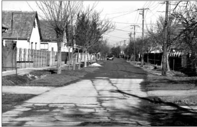
A Mátyás utca Bihar és Széles utcák közötti teljes szakasza aszfalt utburkolatot és zárt csapadékvíz elvezető rendszert kap

szociális bérlakást alakítunk ki. A Kossuth utca 14. szám alatti épületben tetőtér beépítéssel kialakításra kerül egy 61,56 m 2 -es és egy 35,14 m 2 -es, míg a Nagymező utca 33. szám alatti épületben egy 67,41 m 2 -es szociális bérlakás. Egy 76,64 m 2 -es szociális lakás kialakítására is sor kerül a Béke sétány 5. sz. alatti épület szintén önkormányzati tulajdonban lévő tetőterében. A Mátyás utca Bihar és Széles utcák közötti teljes szakaszán, 532 m hosszban aszfaltburkolatú út épül és zárt csapadékvíz el-