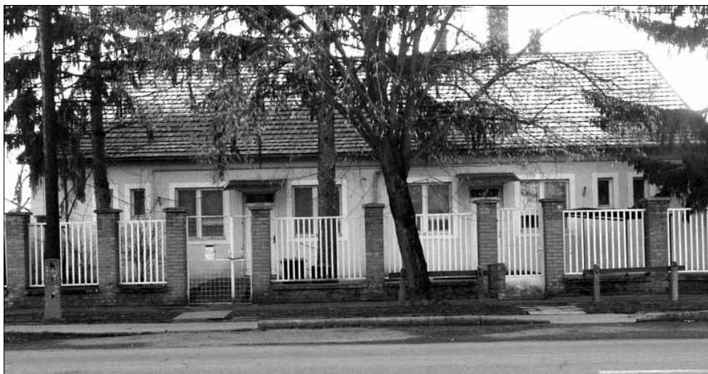
A Vasút utca 16. szám alatti volt Tüdőgondozó épületéből közösségi ház kerül kialakításra

Az infrastrukturális projekt keretében önkormányzati tulajdonú ingatlanokban 3 db