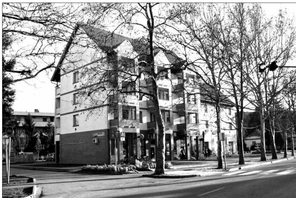
A Kossuth utca 14. szám alatti épület tetőterében két új bérlakást alakítottunk ki

Sarkad Város Önkormányzata a lakosság életkörülményeinek emelése, a meglévő társadalmi és infrastrukturális különbségek mérséklése, a hátrányos helyzetű emberek munkaerő-piaci helyzetének javítása, valamint a város szegregátumai-ban élők közösségi és egyé-