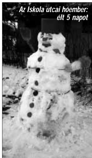
Az Iskola utcai hóember: élt 5 napot