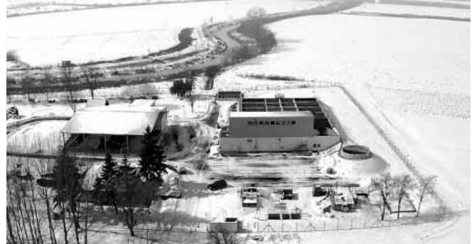
Az új szennyvíztisztító képes a város összes szennyezett vizét tisztítani