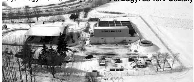
Az új szennyvíztisztító képes a város összes szennyvizét tisztítani

A bevalláshoz szükséges nyomtatvány elérhető a város honlapján, illetve beszerezhető az önkormányzat adóhatóságánál a Polgármesteri Hivatal 24.-25. irodájában. A kitöltésben igény esetén az adóhatóság dolgozói segítséget nyújtanak. A bevallás adatainak ellenőrzéséhez, kérjük mellékeljük vagy hozzák maguk-