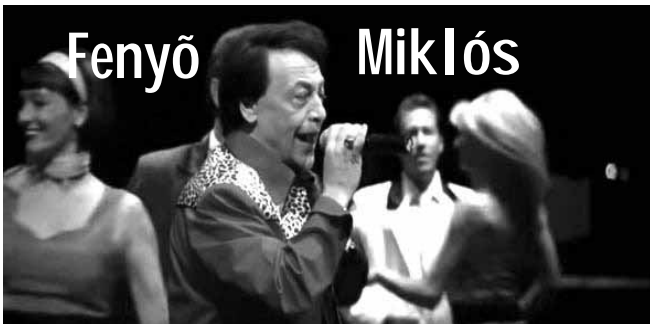
20.30 óra nagykoncert