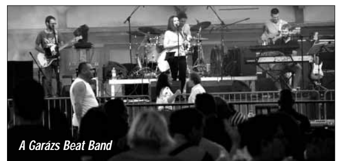
A Garázs Beat Band