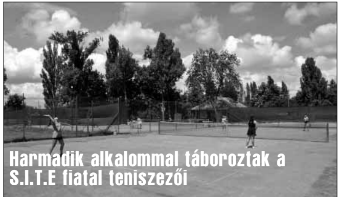
Harmadik alkalommal táboroztak a S.I.T.E fiatal teniszezői

Sarkadi Bórkás Horgászegyesület vezetősége