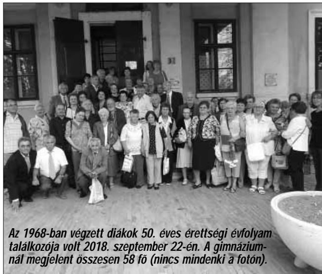
Az 1968-ban végzett diákok 50. éves érettségi évfordulóját találkozták 2018. szeptember 22-én. A gimnáziumnál megjelent összesen 58 fő (nincs mindenki a fotón).