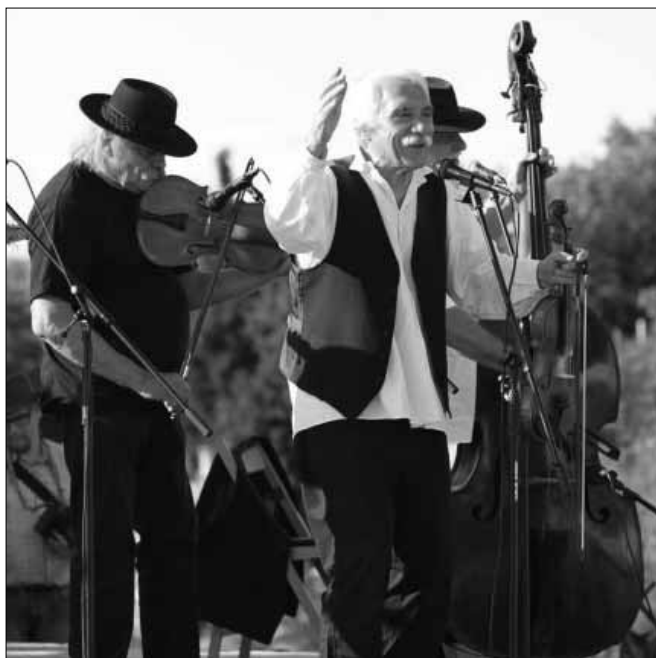
A Kossuth-díjas Muzsikás Együttes