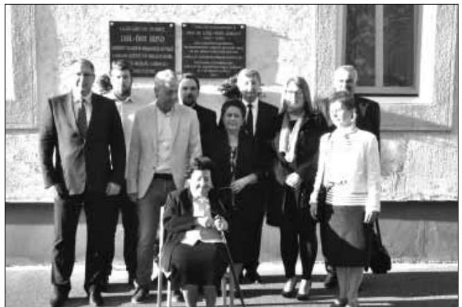
Az emléktáblák előtt a Leel-Össy család, egyházi vezetők és Sarkad város vezetése

a Sarkad-Belvárosi Református Templom 150 éves újjáépítésé alkalmából