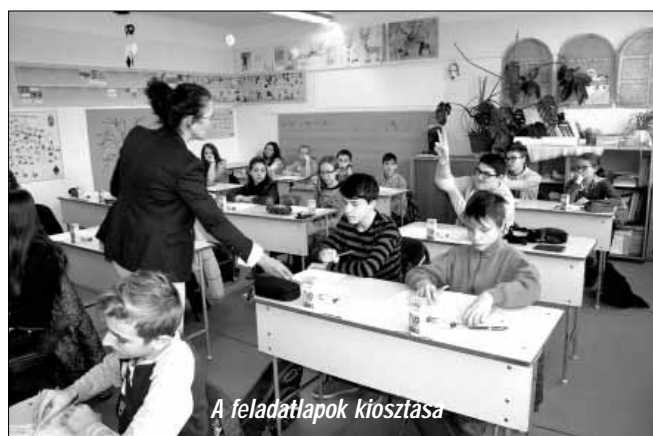
A feladatlapok kiosztása

rült sor a Bartók Béla Művelődési Központban. A megyei eredményhirdetésre az évfolyamonként (2. osztálytól 12. osztályig) legjobb eredményt elérő 141 általános iskolai és középiskolai tanuló, valamint az őket felkészítő legeredményesebb pedagógusok kaptak meghívást. A legjobbak a megye 33 általános és 7 középiskoláját képviselték. A házigazdák vidám műsorral nyitották meg a rendezvényt, majd dr. Mokán István polgármester köszöntötte a városunkba érkező vendégeinket. Ezután vette kezdetét az izgalommal várt díjátadás. Nagy örömmel szolgált, hogy ebben az évben is voltak sarkadi diákok a legjobbak között, Nagy Be-