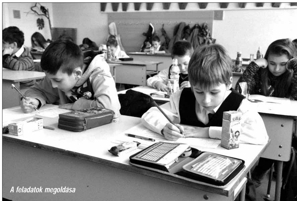
A feladatok megoldása

A versenyt követő megyei eredményhirdetés és díjkiosztó ünnepség szervezését és lebonyolítását is a helyi általános iskola pedagógusai végezték. Az ünnepélyes keretek között megrendezett eseményre március 7-én ke-