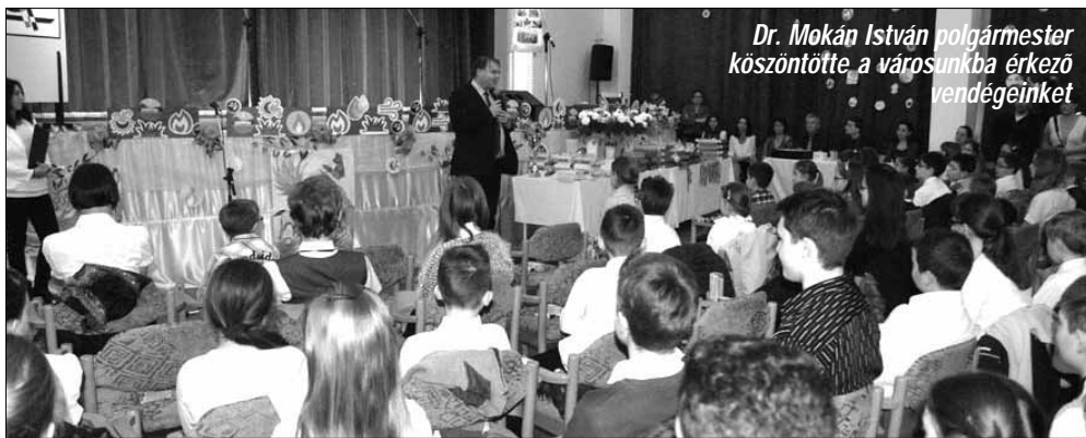
Dr. Mokán István polgármester köszöntötte a városunkba érkező vendégeinket