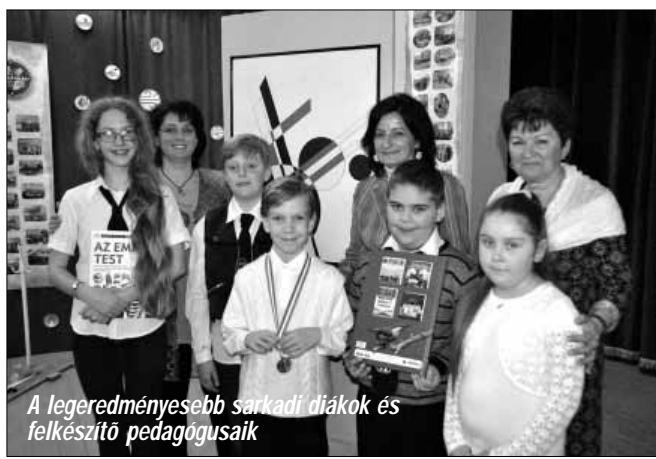
A legeredményesebb sarkadi diákok és felkészítő pedagógusaik