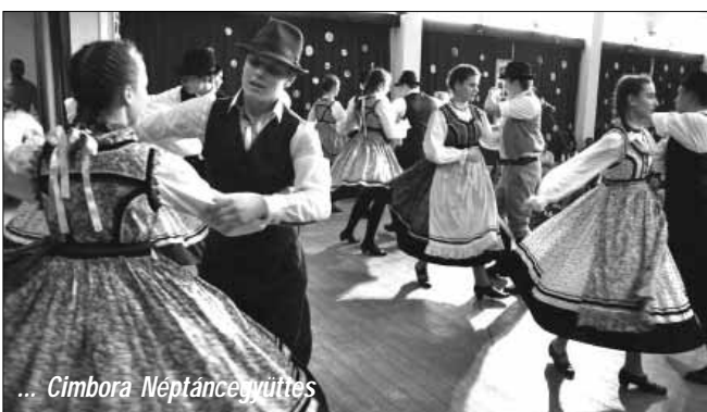
... Cimborá Neptáncgyűjtés