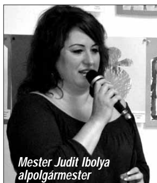
Mester Judit Ibolya alpolgármester

2017. március 24-én óvodánkban ismét megrendezésre került az „Epreskeri Színes Világ” OVI-GALÉRIA, ahol 64 gyermek 83 alkotása került kiállításra.