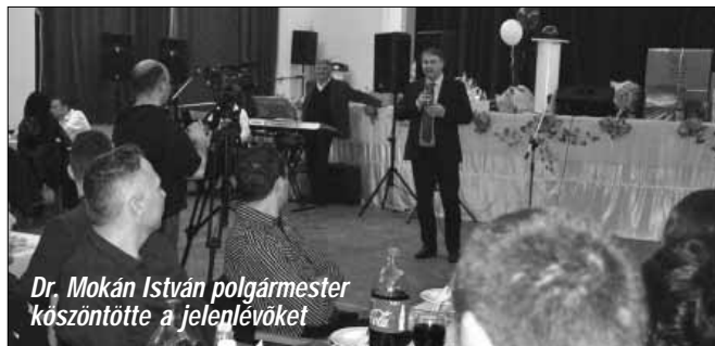
Dr. Mokán István polgármester köszöntötte a jelenlévőket