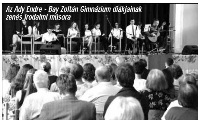
Az Ady Endre - Bay Zoltán Gimnázium diákjainak zenés irodalmi műsora