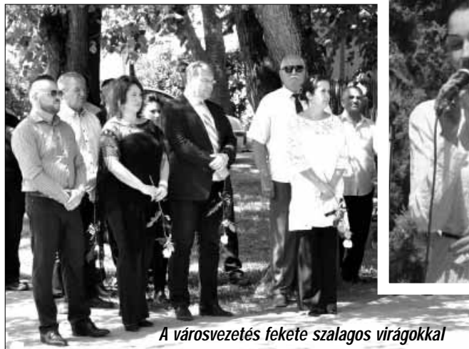
A városvezetés fekete szalagos virágokkal