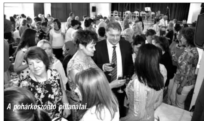
A pohárköszöntő pillanatai.