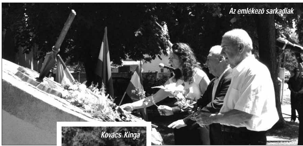
Az emlékező sarkadiak