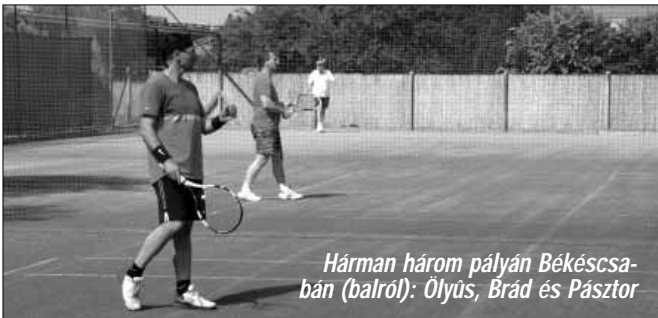
Hárman három pályán Békéscsában (balról): Ölyüs, Brád és Pásztor

A kedvező időjárásnak köszönhetően az idén valamivel korábban kezdődött a Kinizsi Tenisz Klub tagjainak a szabadtéri játék, már áprilisban megkezdtek a versenyekre való felkészülést. A különböző kupaversenyeken tagjaink figyelemre méltó helyezéseket értek el, ha nem is a legmagasabb fokára, de dobogóra álltak és folytatják a rendszeres felkészülést a következő versenyekre.