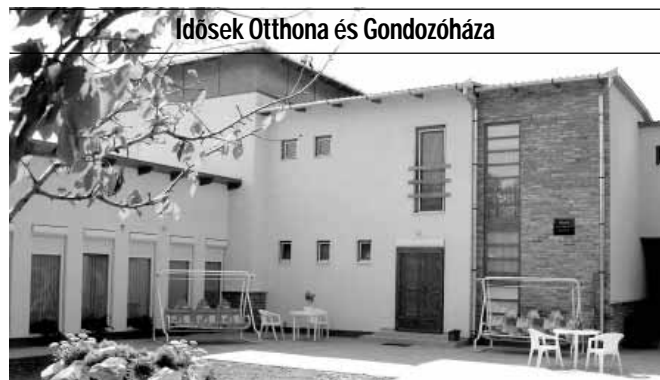
Idősek Otthona és Gondozóháza

A Gyulai u. 8. szám alatti Idősek Otthona és Gondozóháza akadálymentesített, parkosított, kellemes környezetben, családias légkörben, emelt szintű 2 ágyas, fürdőszobás szobákkal várja az idősek jelentkezését. Az otthon komplex, személyre szóló teljes körű ellátás, aktív pihenés keretében biztosítja lakói számára a kiegyensúlyozott életet.