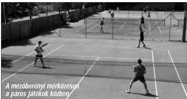
A mezőberényi mérkőzésen a páros játékok közben