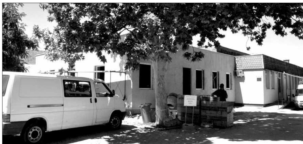
Július 13-án a villanyszerelési munkák folytak a belső térben és helyére kerültek az ablakok

Tekintettel arra, hogy napjainkban már jogszabály által előírt kötelezettség a diétás étrend biztosítása is, ezért ezen feladattal az optimális feltételrendszerének megteremtése érdekében az elmúlt