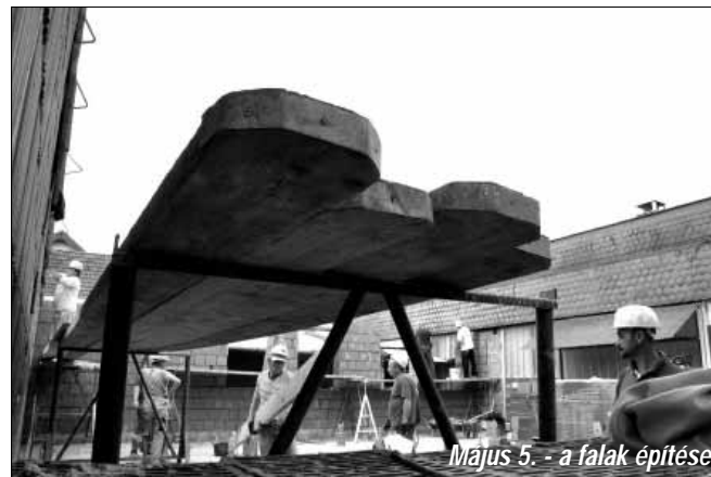
Május 5. - a falak építése

zik a munkát, amely ez év őszére fog befejeződni, elkészülni.