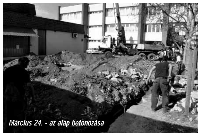
Március 24. - az alap betonozása