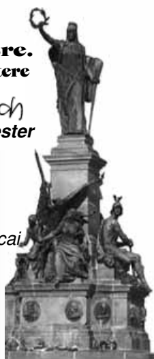
(Az aradi Szabadság szobor)