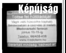
Képtűság 24 óraban