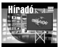
Friss közéleti hírek