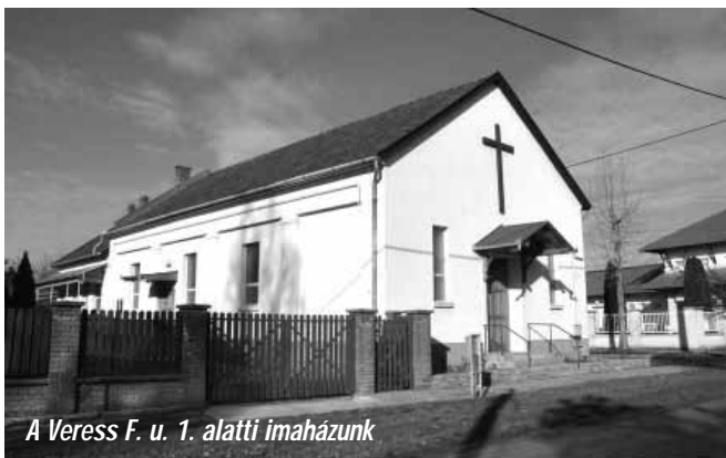
A Veress F. u. 1. alatti imaházunk

Amikor turistaként látogatunk el egy városba, akkor a történelmi épületek, művészeti értékek, vagy éppen a szórakozási lehetőségek miatt lesz fontos a számunkra. Sarkad viszont a lakóhelyünk, ennek értékét az adhatja, hogy szeretünk itt lakni, otthonosan érezzük magunkat benne. Hozzájárul ehhez az a sokféle, kisebb-nagyobb közösség is, amely a közös érdeklődés, elköteleződés mentén kapcsol össze embereket. Egy-egy ilyen közösségnek a múltja és a jelene is értéket hordoz. A hagyományok és a művészetek megőrzése, az élet-szemlélet, a hit átadása, a baráti kapcsolatok ápolása mind olyan dolog, amelyek nélkül szegényebb lenne az életünk.