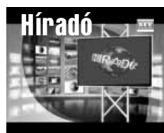
Friss közéleti hírek (ism)