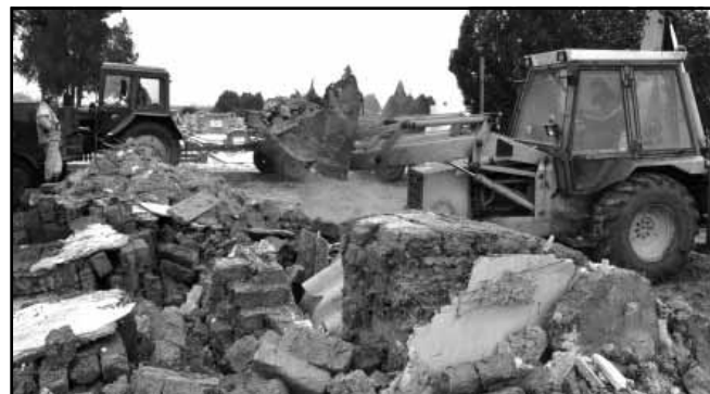
ruházt és fejlesztést, amit folyamatosan végez tavaly tavasz óta a Városgazdál-

dási Iroda, így előbb a sírkert átfogó takarítására, a felhalmozódott szemét elszállítá-