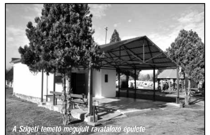
A Szigeti temető megújult ravatalozó épülete