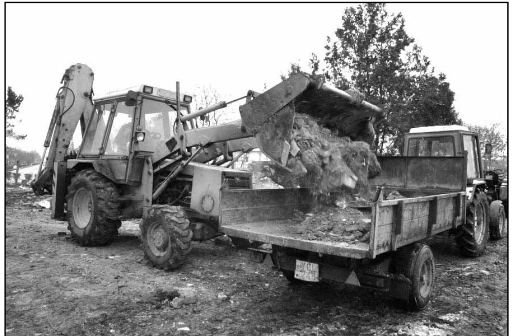
Sor került a már teljesen elaggott, omladozó csőszház elbontására és az építési törmelék elszállítására