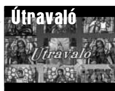
Vallásos gondolatok 4 percben

Jövő heti műsor: január 21-én (csütörtökön) 19.00 órai kezdettel, ismétlés 22-én (pénteken) 10.00 órakor