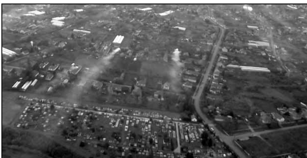
Sarkad látképe a magasból (Méhkerék irányából), a kép alján a Szigeti temető

ezzel is tovább javítva a temető környezetének összképén. Szintén a temetőbe látogatók komfortérzetét növeli, hogy a nemrég lezárt szociális városrehabilitációs programnak köszönhetően új parkoló épült a temetővel szemben található József Attila téren, illetve új, figyelemfelhívó fényekkel ellátott gyalogátkelő biztosítja a sírkert főbejáratának megközelítését a forgalmas Szalontai úton átkelő számára.