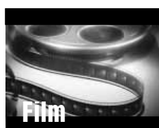
Örökségünk: régi magyar film