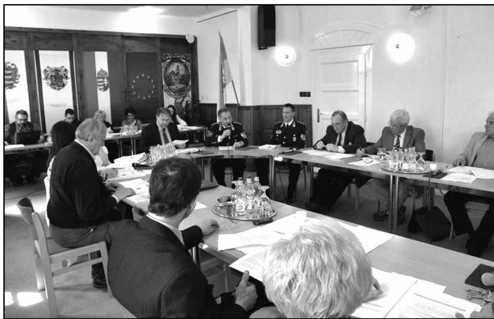
Az első napirendi pontok között beszámolt munkájáról a Gyulai Hivatásos Tűzoltóparancsnokság

A rendeletalkotás tárgykörében, a lakossági kéréseket figyelembe véve módosította a képviselő-testület a temetőkről és a temetkezésről szóló önkormányzati rendeletet. Az utóbbi időben többen kérték, hogy az önkormányzat tegye lehetővé a sírhelyek előre történő megváltását. A polgármester elmondta, bizonyos élethelyzetekben teljesen érthető ez a kérés, ezért a városatyák egy objektív tényezőhöz kötve a rendeletmódosítással lehetővé tették a sírhelyek előre történő megváltását. Ez az objektív tényező a 65. életév. A módosított rendelet 8. §-a értelmében minden 65. életévét betöltő lakos válthat