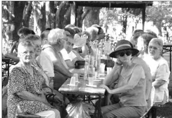
Nagyszalontáról is érkeztek nyugdíjasok erre a napra