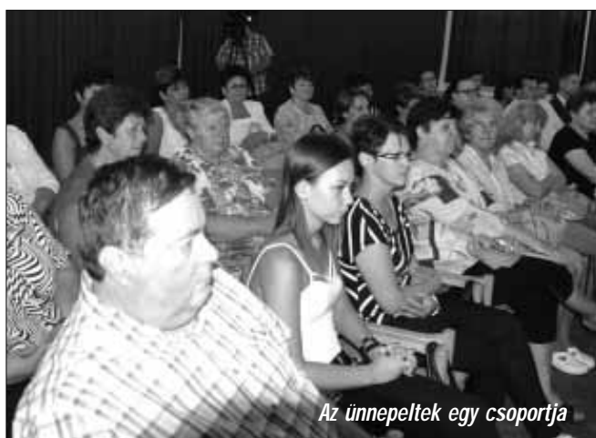
Az ünnepeltek egy csoportja