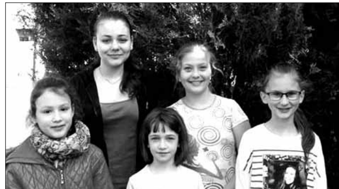
„Az év hangja” szavalóverseny résztvevői