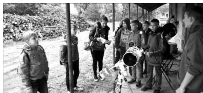
Csillagászati versenyen jártak, a távcsövel ismerkednek