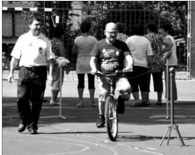
Kerékpáros ügyességi próba a Sarkadi Rendőrkapitányság segítségével