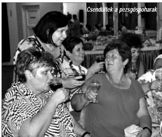
Csendültek a pezsgőspoharak