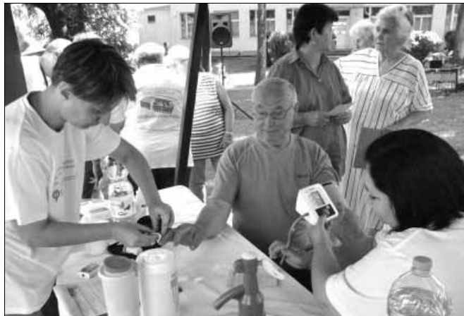
Vérnyomás- és vércukor mérés