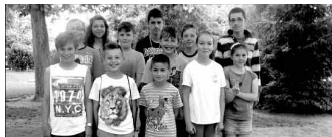
A 2016-os horgász Sulikupa döntőjén is részt vettek