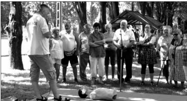
„Újraélesztési” gyakorlat a helyi mentősök irányításával