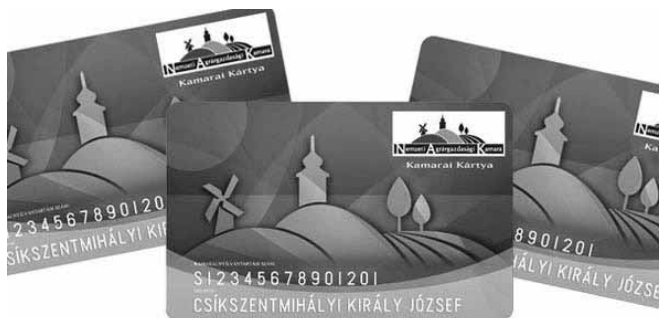
Plasztik kátya az új őstermelői igazolvány