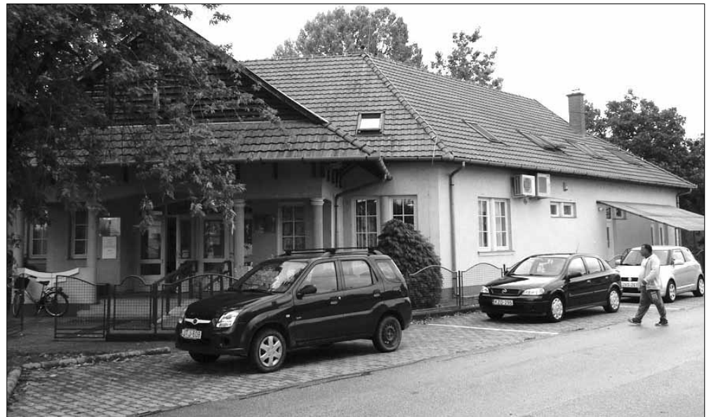
Elkezdődött a Sarkadi Járási Hivatal székhelyének kiemelt épületenergetikai fejlesztése

Magyarország Kormányának célul tűzte ki az alacsony szén-dioxid-kibocsátású gazdaság felé történő elmozdulást, mely cél a költségvetési szervek együttműködésével tervez megvalósítani.