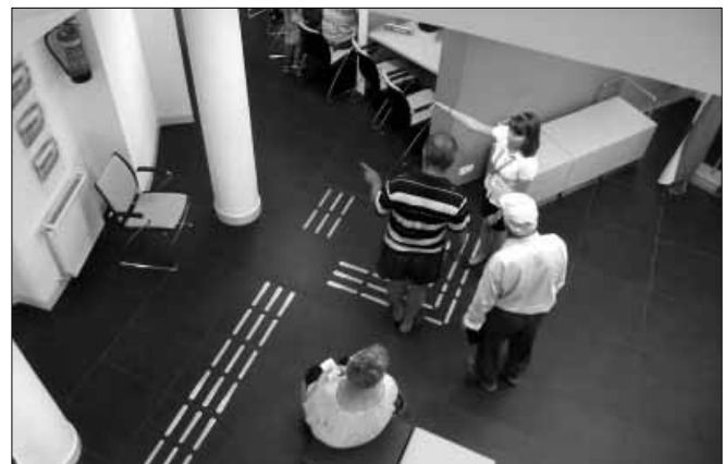
Az ügyfélfogadás a fejlesztés idején zavartalan marad