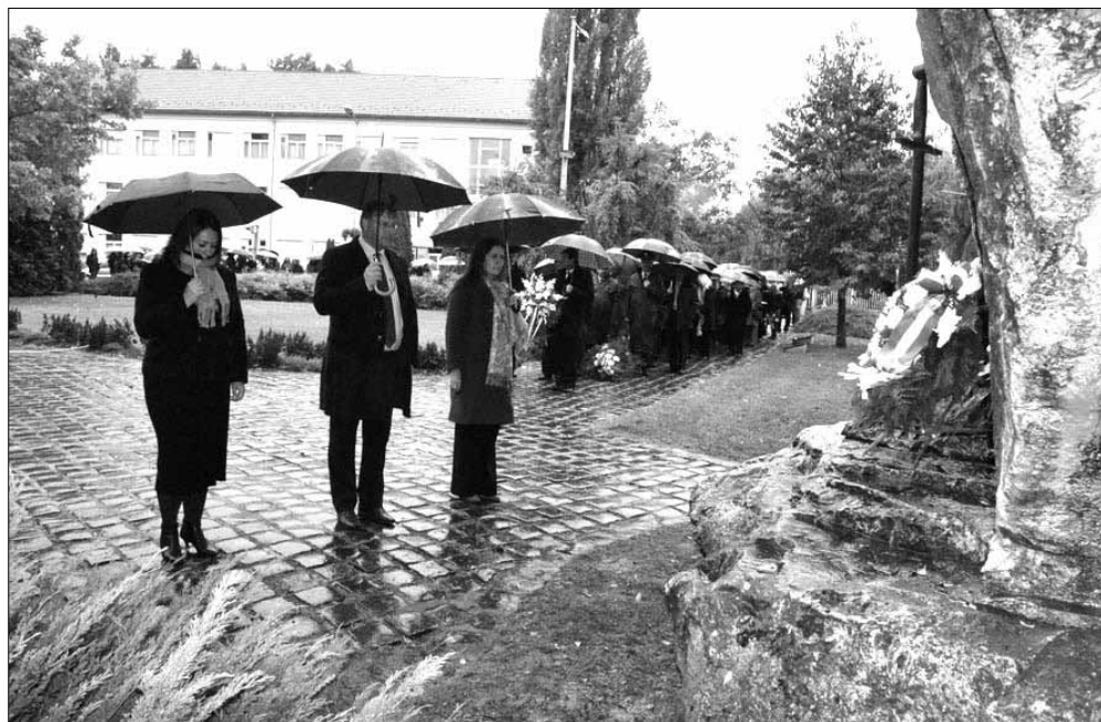
Az Aradi Vértanúk emlékműve talapzatára elsőként a városvezetés helyezte el az emlékezés virágait

Emlékeznünk kell, hiszen ez az utódok dolga, ez a mi feladatunk. Ezt hagyták ránk azok, akik a vérüket adták október hatodikán. Itt, Sarkadon is meg kell tennünk ezt. Meg kell idéznünk a vértanúk szellemét, még ha időben és térben talán távolinak is tűnik számunkra Arad és az aradi tizenhárom. De ha jobban belegondolunk, nem is vagyunk sem időben, sem térben olyan távol tőlük, mivel az emléküket még ma is őrizzük, és földrajzilag sincs tá-