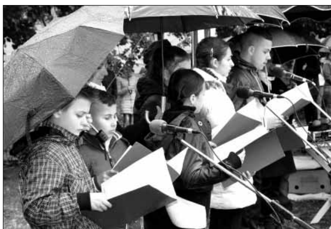
Az emlékműsort adó Kossuth utcai Általános Iskola diákjai