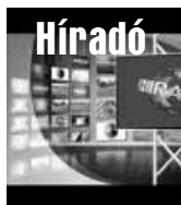
Friss közéleti hírek