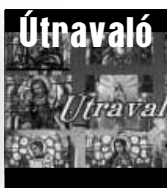
Egyházi gondolatok öt percben