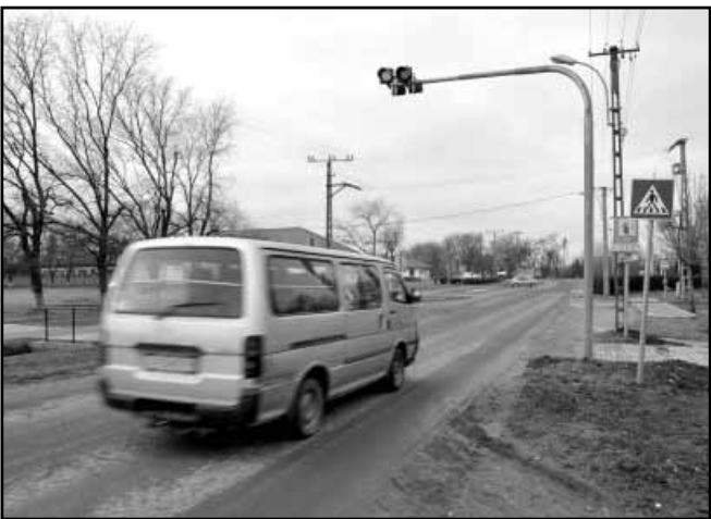
Az Anti úton, a városi piac bejáratánál megépült a régóta hiányolt gyalogos átkelőhely