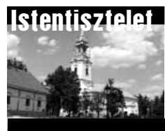
Belvárosi Református Templom