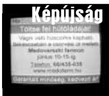
Képiújság 24 órában