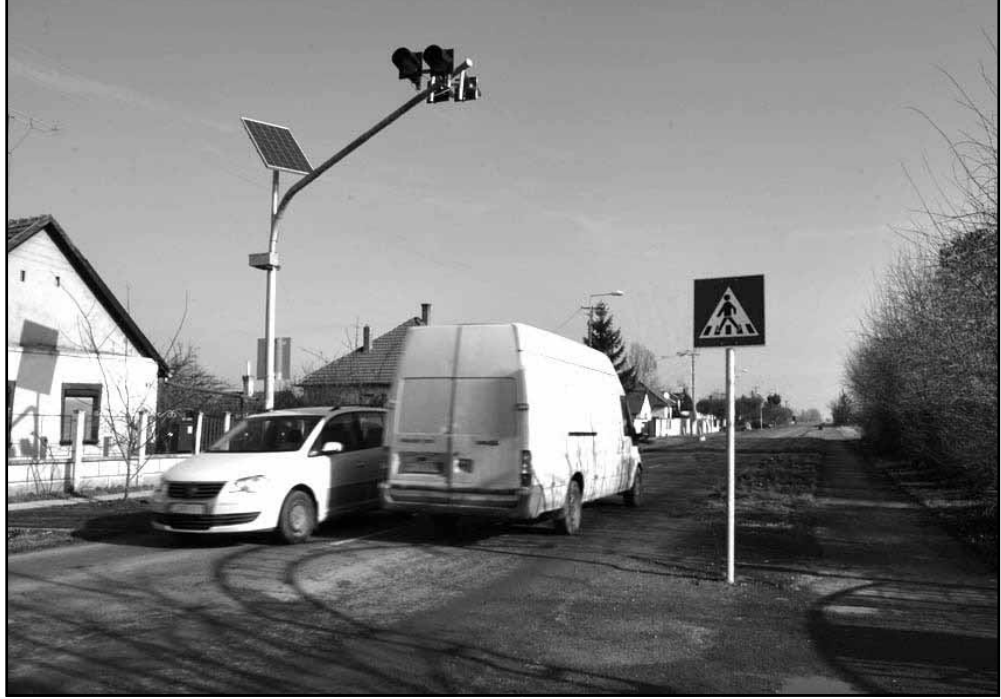
A Szalontai úton, a Szigeti temető előtt a kijelölt gyalogos átkelőhelyhez kapcsolódóan kiépült egy radaros sebességjelző berendezés is

Új zebrát került kialakításra a Szalontai úton, a Szigeti temető előtt a „Komplex fejlesztés a szociális célú városrehabilitáció jegyében Sarkadon” (DAOP-5.1.1-09-2F2012-0002) című projektnek köszönhetően. Ezen beruházás értéke 4.738.877 Ft volt, mert a kijelölt gyalogos átkelőhelyhez kapcsolódóan kiépült egy radaros sebességjelző berendezés is. A kivitelezési költség 84,83%-ban vissza nem térítendő támogatásból (4.019.989 Ft), valamint 15,17%-ban önkormányzati forrásból (718.888 Ft) valósult meg. A beruházás 2014 decemberében került átadásra a sarkadi Podeszt Kft. kivitelezésében. Eleget téve a már évekkal ezelőtti megfogalmazott lakossági igényeknek és a választási ígéreteknek a második és a harmadik újabb gyalogos átkelőhely az újteleki városrészen épült meg, illetve van folyamatban azok kiépítése. A Gyulai út - Damjanich utca csomópontjában és az Anti úton, a városi piac bejáratánál létesültek az újabb zebrák, melyek kivitelezési költségét teljes mértékben az önkormányzati biztosította 6.800.000 Ft értékben.