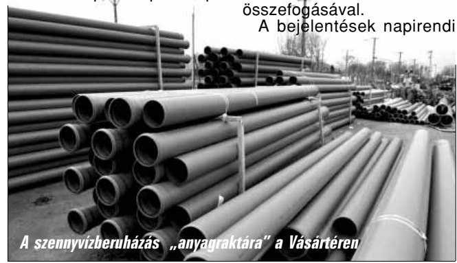
A szennyvízberuházás „anyagraktára” a Vásártéren