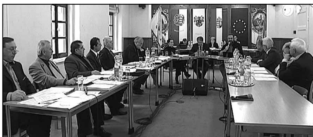
A képviselő-testület január 29-ei munkanapján

A bejelentések napirendi pont keretében született döntés a Sarkadi Közékeztetési Intézmény dolgozói létszámának egy fővel való emeléséről, valamint a cukorgyári vasútállomásnál lévő, leromlott állapotú, állami tulajdonú ingatlanon fekvő bekötőtű felújításának megoldásáról, mely utóbbi felújítás szükségességére még az elmúlt év februárjában megtartott képviselő-testületi ülésen hívta fel a figyelt