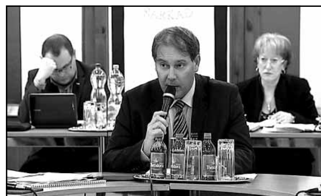
Dr. Mokán István polgármester tájékoztatója

pont a képviselők interpellációival kezdődött, majd több kérdésben is fontos döntések születtek.