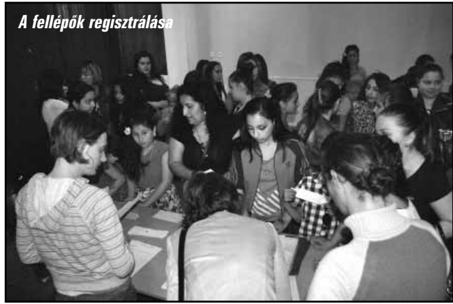
A fellépők regisztrálása

A kultúra olyan, a köznapis ember számára is érthető és élvezhető üzenetet hordoz bármely művészeti ág esetében, ami a másság, az egység, jelen esetben a nemzetiséghez tartozás elfogadását és megértését segíti elő.