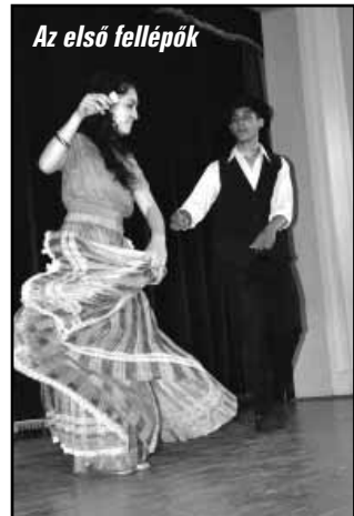
Az első fellépők

Alapítvány fergeteges Tehetség Kutató napját 2015. április 25-én a sarkadi Bartók Béla Művelődési Központban.