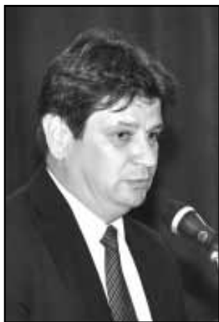
A meghívottakat az ünnepség díszvendége, Gajda Róbert kormány megbízott köszöntötte

A június 29-én megrendezett ünnepségre, melynek a Bartók Béla Művelődési Központ nagyterme adott otthont, meghívásra kerültek a Sarkadi Polgármesteri Hivatal aktív és már megérdemelt nyugdíjas éveiket töltő tisztviselői, a hivatal nem tisztviselő dolgozói, valamint a polgármesteri hivatalban igen értékes munkát végző közfoglalkoztatottak is. Dr. Mokán István polgármester elmondta, a városvezetés kötelességének érzi, hogy a hagyományokat felelevenítve újra