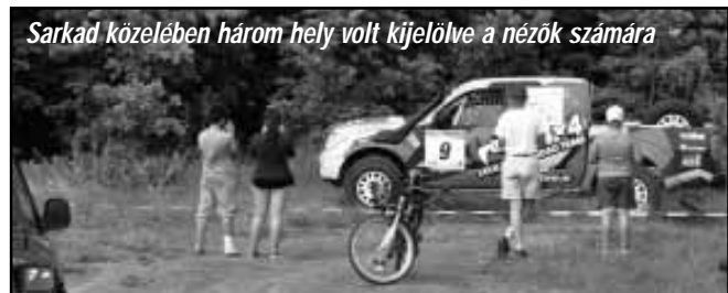
Sarkad közelében három hely volt kijelölve a nézők számára