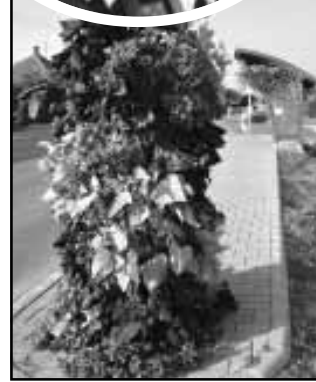
Virághengerek az Újteleki városrész területén