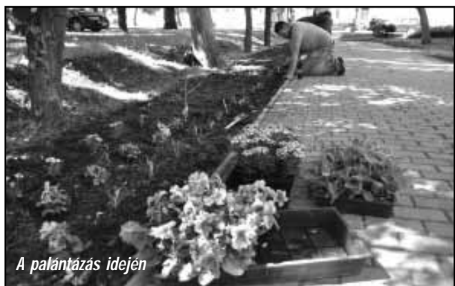
A palántázás idején