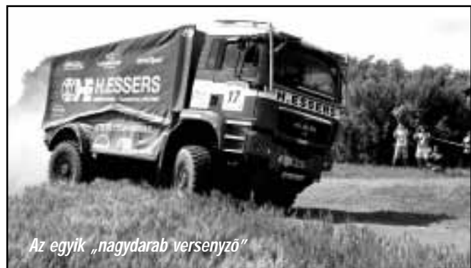
Az egyik „nagydarab versenyző”

A sarkadi szakasz „balszerencsés” eseményei: egy autó az árokba borult jó 100-as tempónál a Matus-tanya környékén (ember nem sérült), egy defektet kapott a földútból kiálló