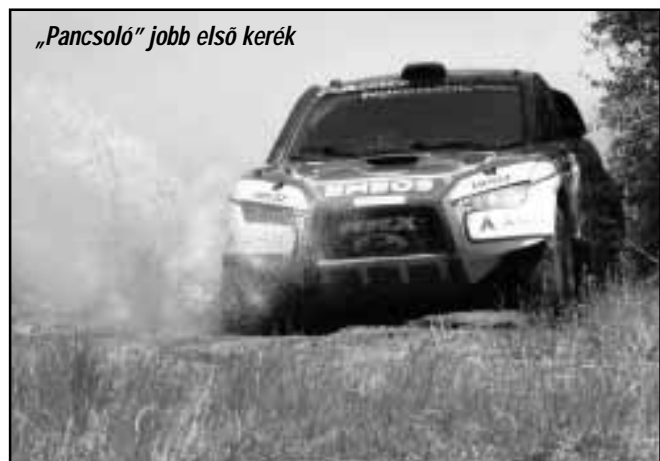
„Pancsoló” jobb első kerék