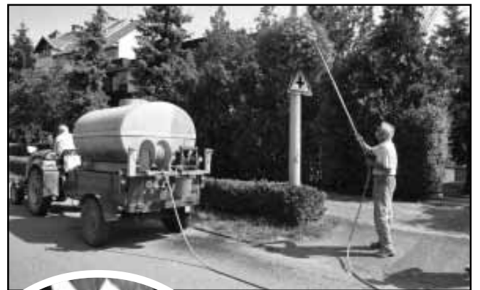
Naponta 4.000 - 4.500 liter vizet használnak öntözésre a Városgazdálkodási Iroda dolgozói

A virágosítás során a munka kivitelezői arra törekedtek, hogy ne csak a városközpont