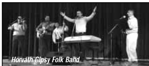
Horváth Gipsy Folk Band