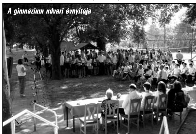
A gimnázium udvari évnyitója

Városunk egyetlen középfokú oktatási intézményében, az Ady Endre - Bay Zoltán (folytatás a 2. oldalon)