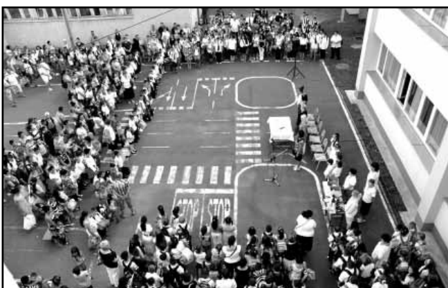
Szeptember 1-jén a Kossuth utcai iskola udvara