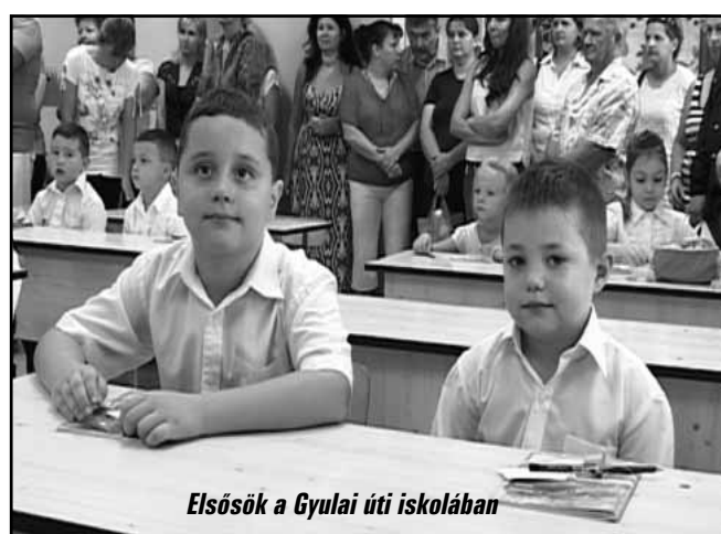
Elsősök a Gyulai úti iskolában