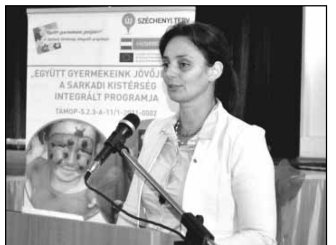
Langerné Victor Katalin, az Emberi Erőforrások Minisztériuma társadalmi felzárkózásért felelős helyettes államtitkára

Ezen túl azért is kiemelkedő és meghatározó volt a Sarkadi Kistérség életében ez a projekt, mert 2012-2015 között 45, főként a kistérségben élő szakembernek biztosított határozott idejű munkaszereződéssel munkát, továbbá több mint 300 szakember került bevonásra megbízási jogviszonyban. A program azonban nem csak munkalehetőség volt, hanem egy