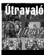
Egyházi gondolatok öt percben

Jövő heti műsor: október 15-én (csütörtökön) 19.00 órai kezdettel, ismétlés 16-án (pénteken) 10.00 órakor