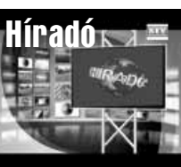
Friss közéleti hírek