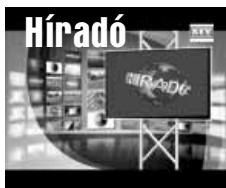
Friss közéleti hírek (ism)