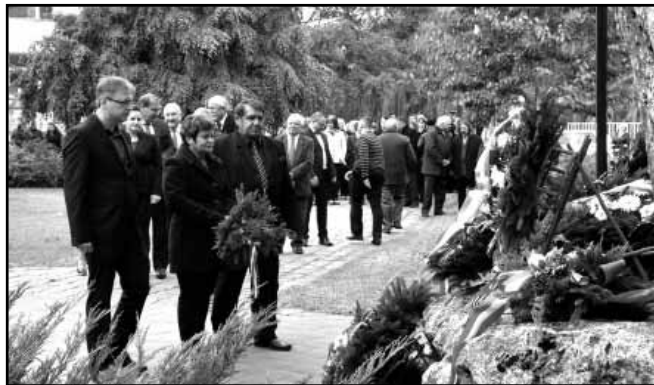
A Sarkadi Ipartestület rendszeresen részt vesz a város közéletében