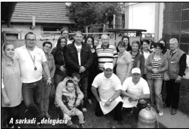
A sarkadi „delegáció”