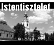
Belvárosi Református Templom