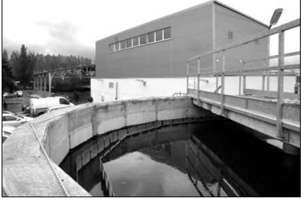
Az újjáépített szennyvíztisztító telep képes a település teljes szennyvizének kezelésére

A sikeresen megvalósított projektnek köszönhetően teljesen újjáépült a város határában lévő szennyvíztisztító telep, ami a korábbihoz képest megduplázott kapacitással már képes a teljes település szennyvizének kezelésére, az ott tisztított szennyvíz minősége már jobb, mint a befogadó Gyepes-csatornáé. A szennyvízelvezető hálózat kialakítása kapcsán 1033 új háztartás kerül bekapcsolásra, több mint 17 km új gerincvezeték, közel 8 km új nyomóvezeték és 2 új át-emelő épült, sorolta a beruházás eredményeit a polgármester, aki külön kitért a beruházáshoz kapcsolódó, október végéig még tartó utépitési munkálatokra is. Az újonnan megépülő szennyvízhálózatához kapcsolódóan nagyon fontos, hogy az érintett utcák burkolata is megújul