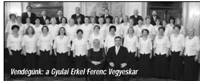
Vendégünk: a Gyulai Erkel Ferenc Vegyeskar

Szeretettel meghívjuk Önt és kedves családját 2015. november 1-én, délután 3 órakor kezdődő reformációi ünnepi hangversenyre A Sarkad-BELVÁROSI REFORMÁTUS TEMPLOMBA