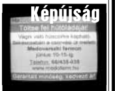
Képtűségi műsor 24 órában