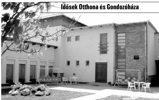
Idősek Otthona és Gondozóháza

A Gyulai u. 8. szám alatti Idősek Otthona és Gondozóháza akadálymentesített, parkosított, kellemes környezetben, családi légkörben, emelt szintű 2 ágyas, fürdőszobás szobákkal várja az idősek jelentkezését. Az otthon komplex, személyre szóló teljes körű ellátás, aktív pihenés keretében biztosítja lakói számára a kiegyensúlyozott életet.