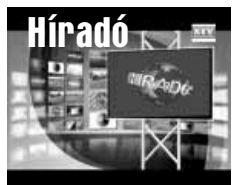
Friss közéleti hírek (ism)