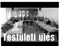
Képviselők októberi tanácskozása