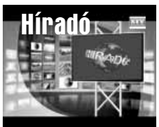
Friss közéleti hírek