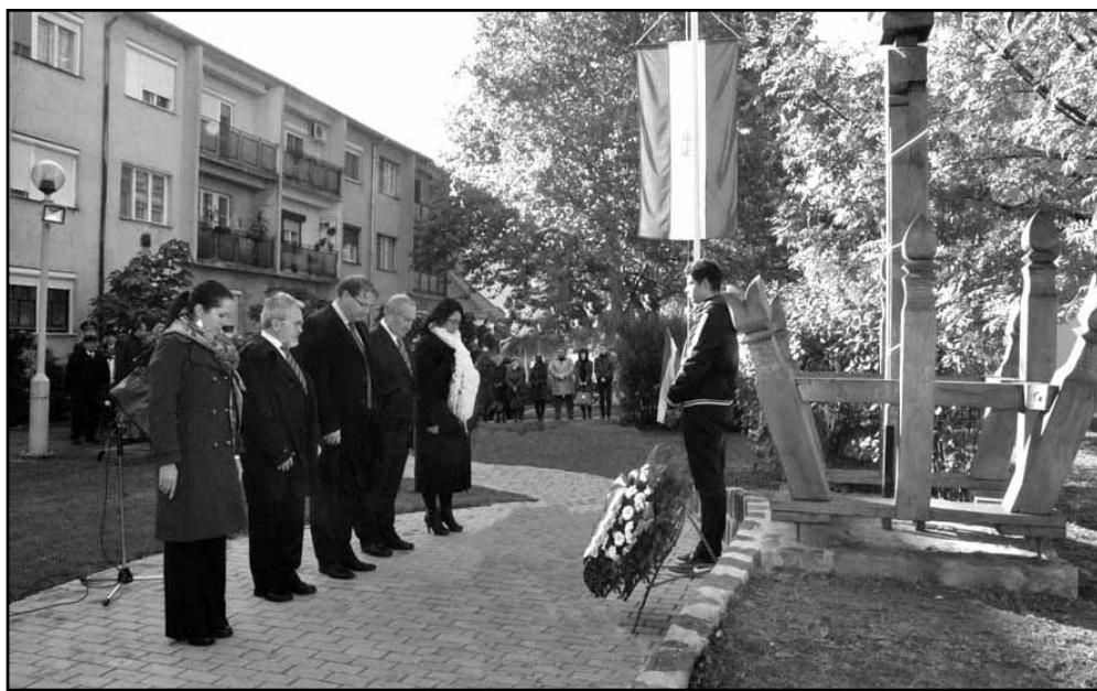
Elsőként a városvezetés helyezte el az emlékezés koszorúját

A Központi Orvosi Rendelő előtt álló '56-os kopjafacsoportnál tartott ünnepséget megelőzően - immár hagyományosan - a városvezetés, a Sarkadi Rendőrkapitány tiszteje és a Városszépítő Egyesület képviselői megkoszorúzták a rendőrkapitányság épületének falán elhelyezett emléktáblát (1. kis kép). A városi ünnepségnek helyt adó emlékműnél előbb az Ady Endre - Bay Zoltán Középiskola diákjainak színvonalas, forradalmi időket