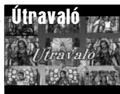
Vallásos gondolatok öt percben

Jövő heti műsor: november 5-én (csütörtökön) 19.00 órai kezdettel, ismétlés 6-án (pénteken) 10.00 órakor