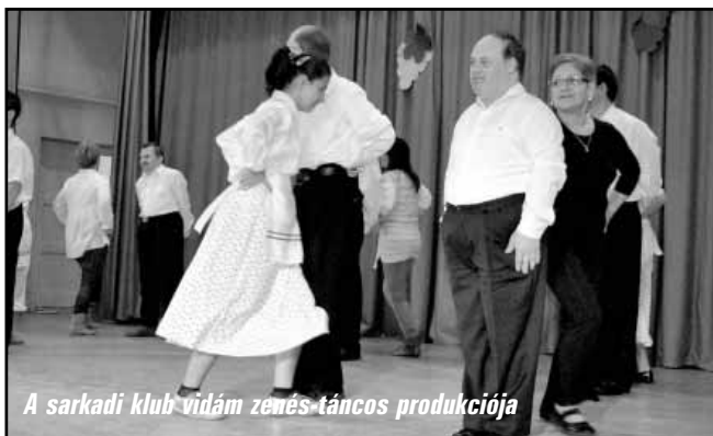
A sarkadi klub vidám zenés-táncos produkciója