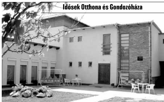
Idősek Otthona és Gondozóháza

A Gyulai u. 8. szám alatti Idősek Otthona és Gondozóháza akadálymentesített, parkosított, kellemes környezetben, családias légkörben, emelt szintű 2 ágyas, fürdőszobás szobákkal várja az idősek jelentkezését. Az otthon komplex, személyre szóló teljes körű ellátás, aktív pihenés keretében biztosítja lakói számára a kiegyensúlyozott életet. Az otthon az időskori szel-