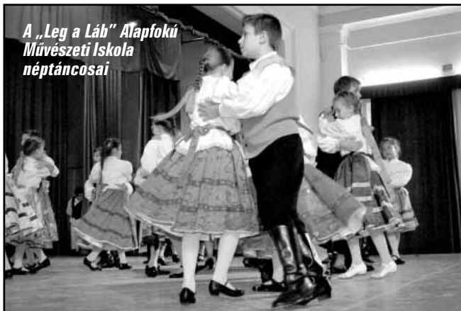
A „Leg a Láb” Alapfokú Művészeti Iskola néptáncosai