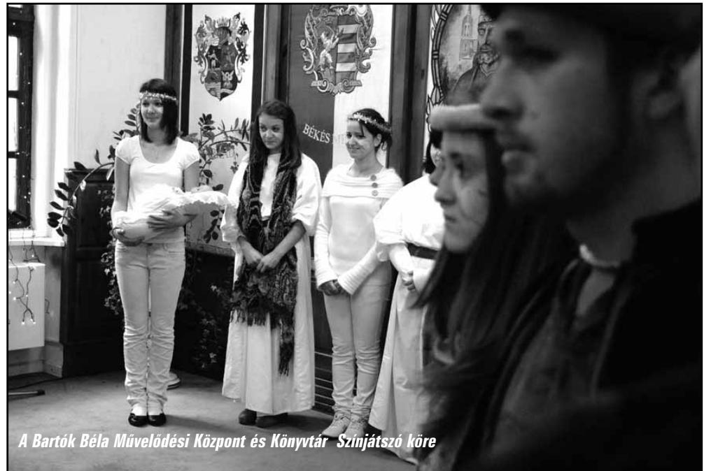
A Bartók Béla Művelődési Központ és Könyvtár Színjászó köre