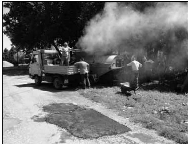
A közút projekt keretében a közfoglalkoztatottak a belterületi utak kátyúzását, illetve a megkopott útburkolati jeleket újították fel.

Sarkad Város Önkormányzata 2013-ban összesen 532 fő közfoglalkoztatottal kötött munkaszerződést. A munkaszerződések időtartama 1 hónap és 12 hónap között mozgott.