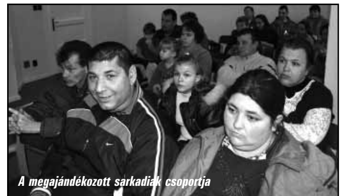
A megajándékozott sarkadiak csoportja