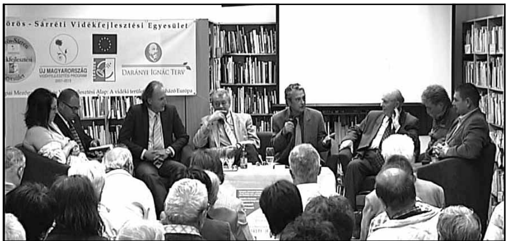
A könyv megszületésének történetét mondják el a szerzők

A kiadvány első fejezete, mely Szabó István munkája, elhelyezi az olvasót a II. világháború időszakában, majd a második rész, Timár Imre révén egy sor igen meghatározó interjúval visszaröpi az olvasót az 1940-es évek Sarkadjára. A könyvben feldolgozott több mint negyven