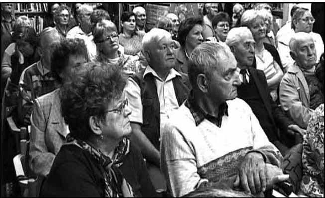
A vendégek között jelen voltak az „emlékezők” is