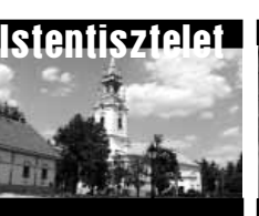
Belvárosi Református Templom