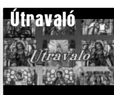
Katolikus gondolatok 1 percben