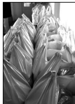
Fűszerpaprika is került a csomagba

Az adomány burgonyából, búzalisztből és fűszerpaprikából állt. A november elején lebonyolított adományosztás kapcsán dr. Mokán István, városunk polgármestere elmondta, hogy a kiosztásra kerülő élelmiszerek a sikeresen megvalósított közmunkaprogram értéktérítő jellegét bizonyítják. A polgár-