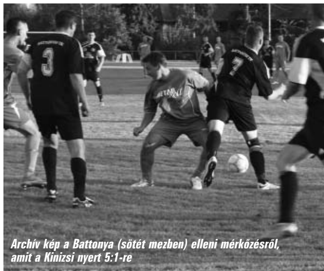
Archív kép a Battonya (sötét mezben) elleni mérkőzésről, amit a Kinizsi nyert 5:1-re

17. forduló 2014. november 30. (vasárnap) 13.00 óra Békéscsabai MÁV SE – Sarkadi Kinizsi LE Az ifjúsági mérkőzés a felnőtt mérkőzés előtt két órával kerül megrendezésre.