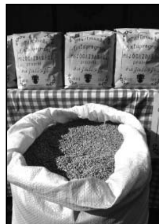
Sarkadi búzából (a zsákban) sarkadi liszt (a zacskóban)