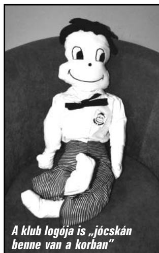
A klub logója is „jócskán benne van a korban”