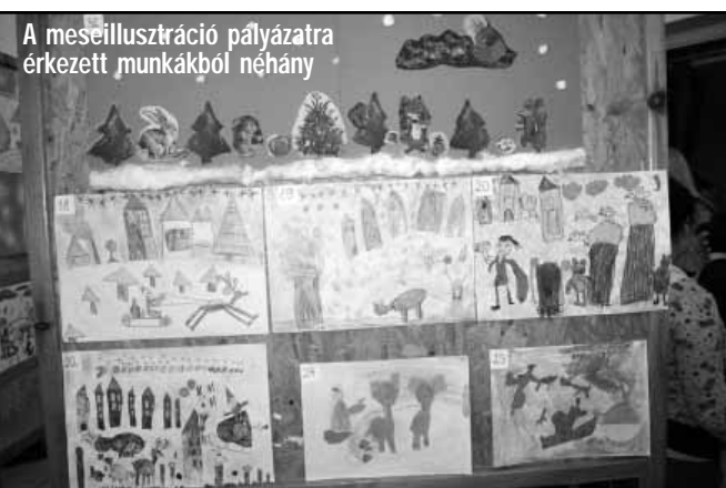
A meseillusztráció pályázatra érkezett munkákból néhány