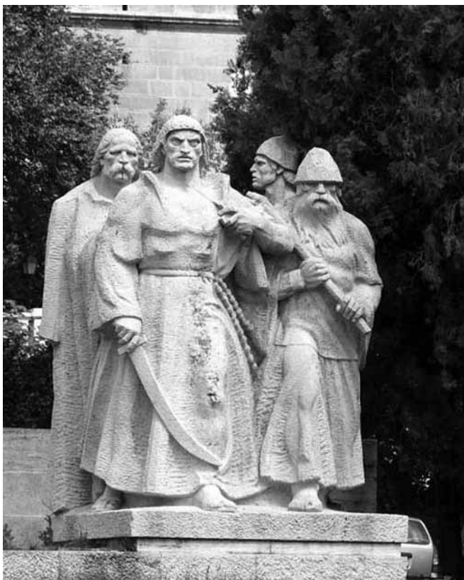
Kiss István 1961-ben mészkőből készített, sokalakos szoborkompozíciója (elől Dózsa György) Budapesten az I. kerületi Dózsa téren