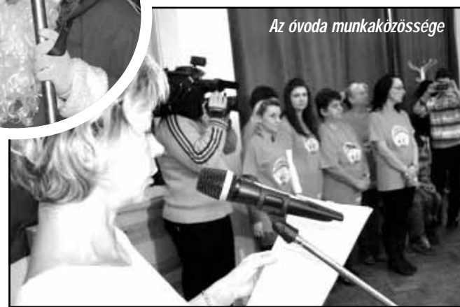
Az óvoda munkaközössége