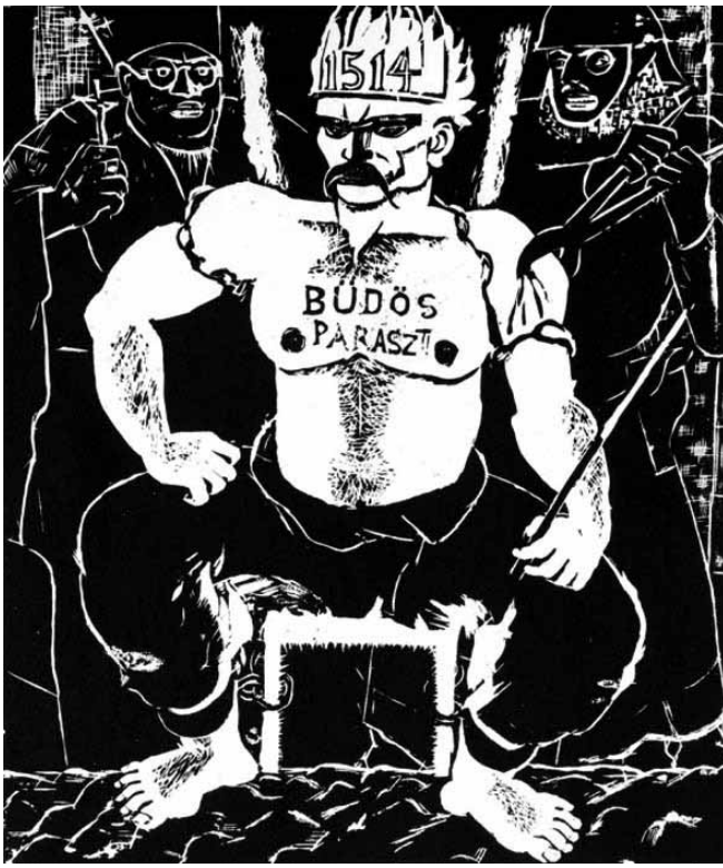
Dózsa György megjelenítése művészi eszközökkel

De mi is volt az a híres székely szabadság, melyért annyi vér, könny, verejték és tinta folyt? Nem tudjuk pontosan a székelység - mint életmód, nép és rendeltetés, mint „nemesi nemzet” eredetét. Az biztos, hogy mindig magyar volt és szabad. Nagy áldozatokkal, zokszó nélkül viselt szigorú életmód egyéni és közösségi vállalásával őrizték, őrizhették meg legtovább a „vezérek korabeli egyenlő szabadságot”. Vagyis a honfoglaláskori (895-896) és a jóval azelőtti társadalmi berendezkedést és világléte, önképet és önazonosságot. Nyilvánvaló, hogy a székely-magyarok, akár csak a „magyari” magyarok, még előttük az avarok és hunok a keleti harcos lovas civilizációk, a nagyállattenyésztő-földművelő kultúrák „gyümölcsei”, hajtásai. Amit