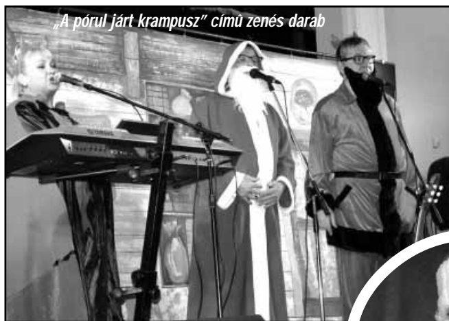
„A pórul járt krampusz” című zenés darab