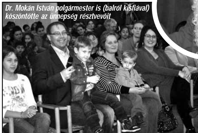
Dr. Mokán István polgármester is (balról kislíával) köszöntötte az ünnepség résztvevőit