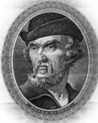
Dózsa a néhány évtizeddel ezelőtt még használt fizetőszöveg, a hús foritason...

Hát igen, minél nagyobb a szabadság, annál nagyobb az árnyéka. A jog és kötelesség ugyanúgy EGY, mint a fa lombja és gyökere, mint dalban a dallam és az ütem. Nincs vagy-vagy! Lassan elköszönve a tisztelt olvasótól, engedtessek meg még egy kérdésfele. Általános iskolában, középiskolában, másutt órákat szentelünk az athéni demokrácia, a spártai állam taglására, a köztársasági, majd a császári Róma, a modern demokráciák és diktatúrák tanulmányozására. Nagyon helyes, rendben. De