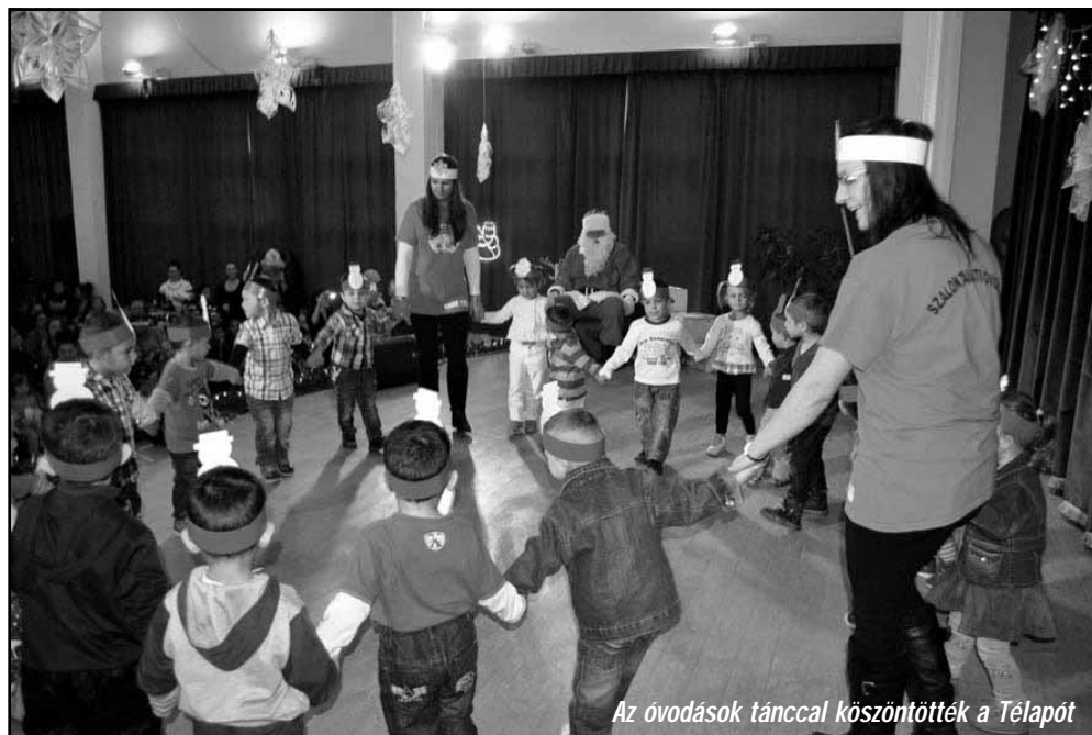
Az óvodások táncra köszöntötték a Télapót