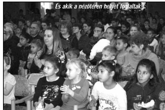
És akik a nézőtéren helyet foglaltak