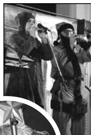
A gyermekek és a szülők együtt tölthettek egy vidám délelőttöt. Reményeink szerint jövőre újra együtt leszünk ezen a szép napon.