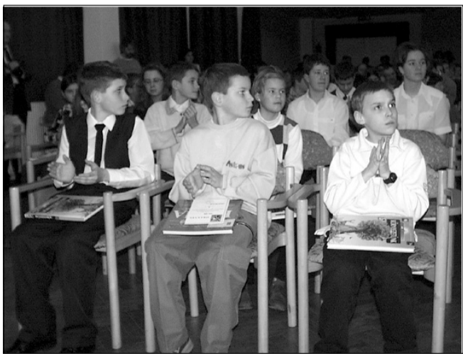
Három sarkadi díjazott az eredményhirdetési ünnepségen

Mint előző számunkban arról már hírt adtunk, Békés megyében 2338 tanuló vett részt a több mint 10 éves hagyományra visszatekintő Zrínyi Ilona Országos Matematika Versenyen. A megyei ünnepélyes eredményhirdetésre, illetve díjkiosztóra március 8-án került sor a Bartók Béla Művelődési Központban. Sarkadi versenyzők nem kerültek be ezúttal az országos döntőbe, de a korosztályonként legjobb 15-nek járó könyv-, illetve játkjutalomban és elismerés-