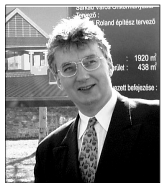
Dr. Semlyén Zsolt államtitkár

tíz éve történetét: az egyházközség visszakapja az említett épületegyüttest ( 6 tanterem és 3 szolgálati lakás), amelyben bentlakásos szociális otthont kíván létrehozni 30-40 idős ember számára állami (pályázati) támogatással, az önkormányzat pedig építtet egy 6 tantermes iskolát.