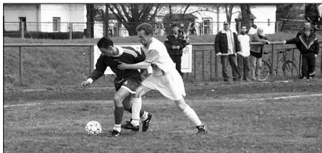
Fehér mezben játszott az első mérkőzésen a Kinizsi

42. perc: Deák vezette át a vendégek térfelére a labdát, majd egy csel után mintegy 25 méterről bődületes kapufát rúgott.