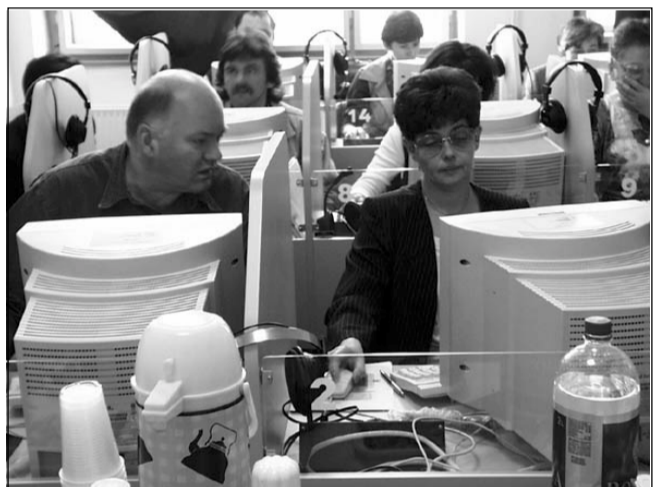
A gimnázium tantermében folyt a gyakorlati oktatás

Április 2-4 között Sarkadon Közzolgálati Műhely