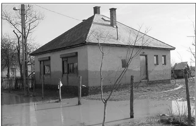
Egy merongálódott épület a 3 922 magánházból

Most a megmaradt ingatlanokba való visszaköltözés fontos feltétele a közműhálózatok helyreállításán felül a fertőtlenítési feladatok végrehajtása, melyhez jelentős szakmai segítséget nyújtottak és nyújtanak a katasztrófavédelmi igazgatóság fertőtlenítéssel foglalkozó szakemberei. -s