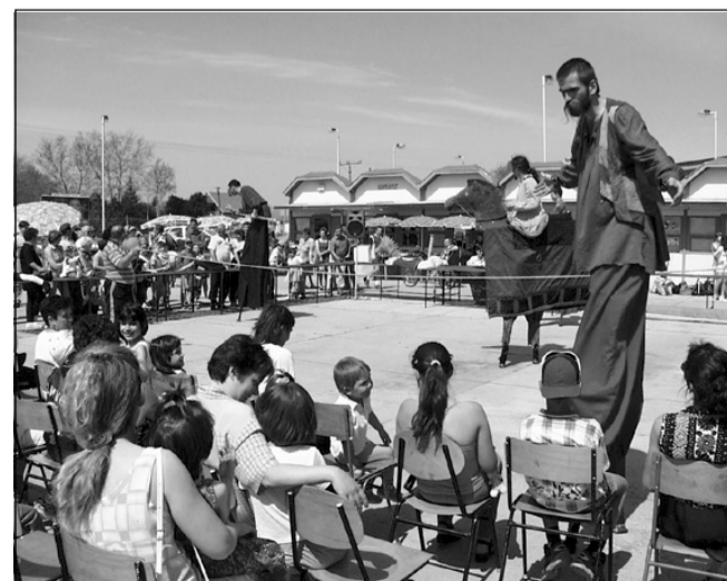
A Langaléta Garabonciások produkciójukkal egy középkori vásár hangulatát idézték fel a sarkadi vásártéren