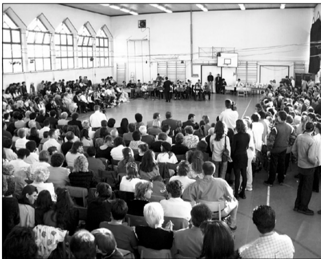
Gyulai Junior Fúvós Zenekar nyitotta a programot

A tavasz a frissesség, a megújulás és az örömszerzés évszaka, amelyet a természet kívül leginkább a még tiszta gyermeki szívek képei közvetítenek felénk, felnőttek felé. Ezt érezhette a mintegy ezer résztvevő a 2. Sz. Általános Iskola jótékony estjén április 28-án, amelyet immár 8. alkalommal rendeztek, meg saját tornacsarnokukban.