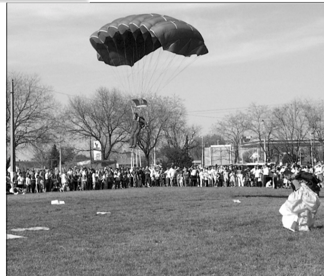
Az ejtőernyős egyesület bemutatója