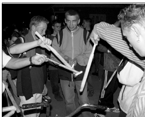
Április 30.: a fáklyák gyújtása