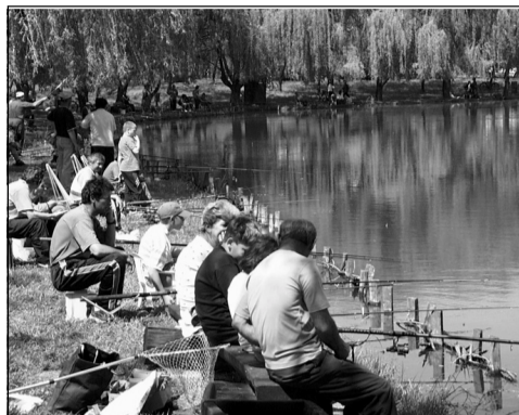
Május elseje: a horgászverseny