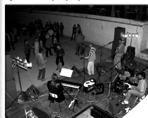
Április 30.: medence buli a sportpályánál