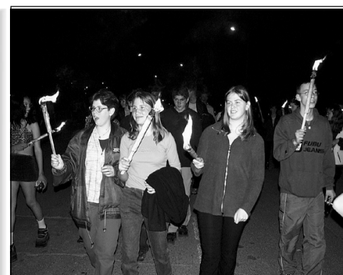
Április 30.: a fáklyás felvonulás résztvevői