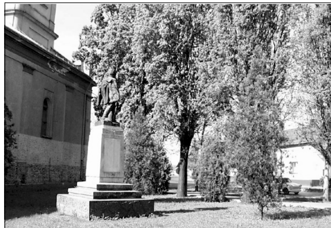
Javulni fog a szobor „kilátása” illetve „belátása”, a jelenlegi helyzet a képen látható