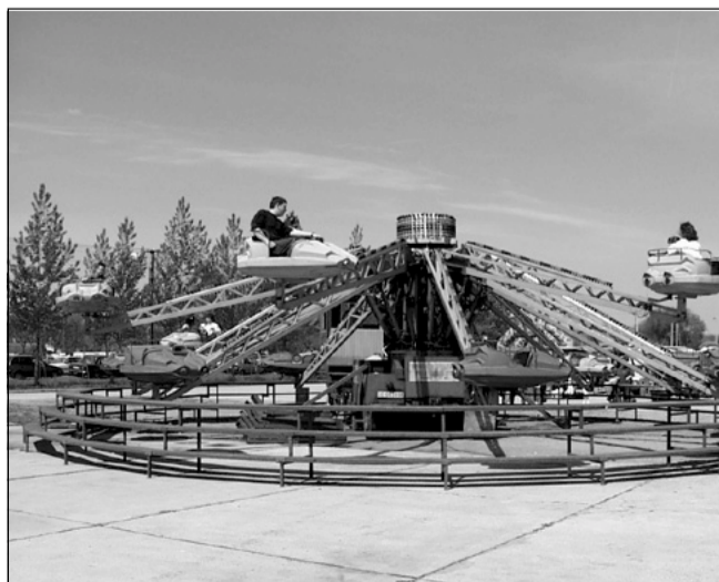
A körforgót is sokan kipróbálták