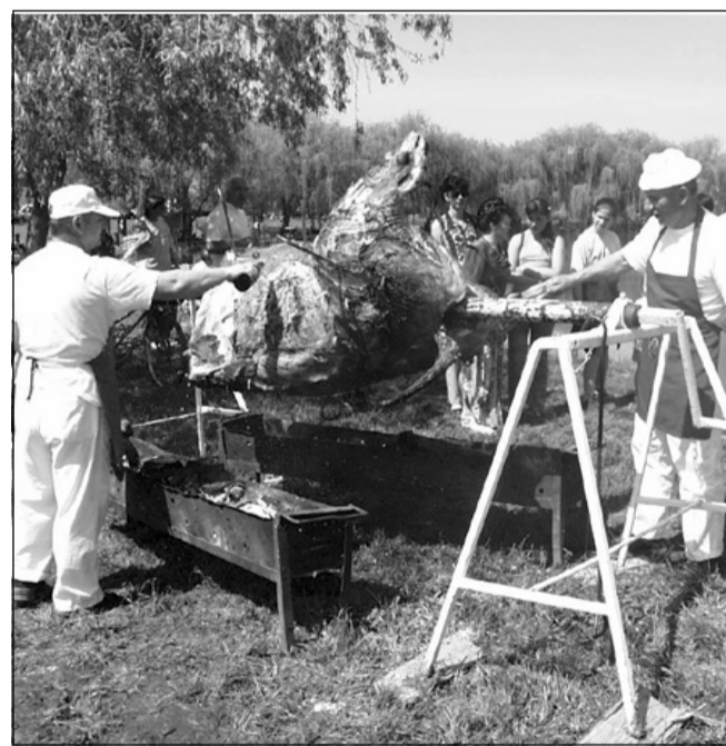
Az ökörsütés két mestere Apajról érkezett Sarkadra