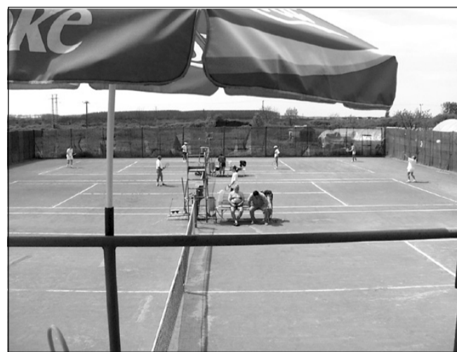
Sarkad – Gyula 7:2

Megkezdődött az idei szabadtéri tenisz versenyszezon, így a megyei férfi csapatbajnokság is.