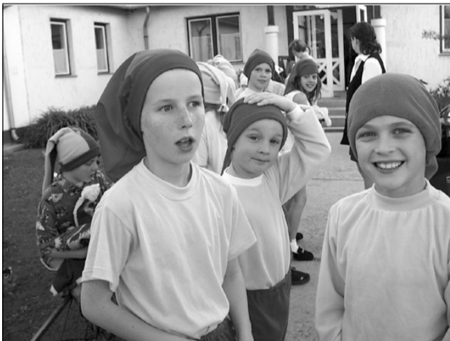
Fellépésre váró gyerekek a „művészbemutató” előtt

(Folytatás az 1. oldalról) kozatás legkülönbözőbb műfajait vonultatták fel. A sodró lendületű show-műsörtől, verses-zenés jelenettől, különleges fényeffektusokkal kísért feldolgozásoktól kezdve a néptáncig, vidám jelenetekig kedvvel örülhetett a résztvevők népes tábora. A meg-megújuló tapsvihar jelezte, hogy a nagyérdemű nemcsak úgy szórakozgat, hanem igazi, felhőtlen örömben, kikapcsolódásban van része, amelyhez a nagyon szépen kidolgozott produkciókon kívül hozzájárult az is, hogy a felkészítő pedagógusok odafigyeltek a jelmezekre és az igen lenyűgöző fényhatásokra is. A szintén vendégként fellépő Shoto-kar Karate Klub gyulai csoportjának izgalmas bemutatója is kellemes színfoltként maradt meg bizonyára mindannyiunkban.