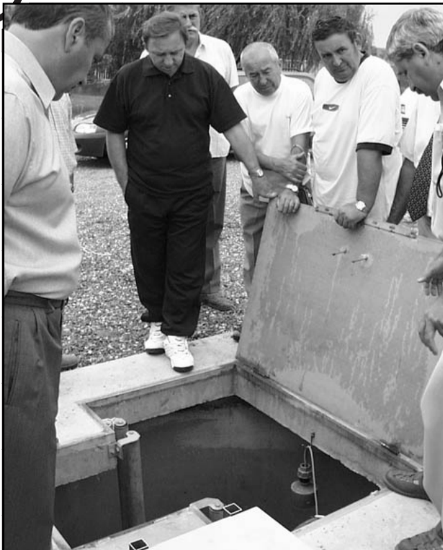
A gerincvezeték 12 km hosszú, amely 6 km hosszú lakossági bekötéssel egészül ki. A 210 millió forint összköltségű beruházás jelenleg 71%-os készültégi fokban van, a csatornahálózat 87%-ban elkészült. Az elmúlt évek legnagyobb csatornaépítési programja reményeink szerint a jogszabály által előírt legalább 90%-os lakossági rákötéssel párosul.