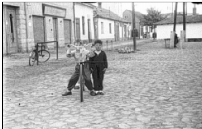
A Piac tér másik „sarka” anno. Két épület napjainkban is látható