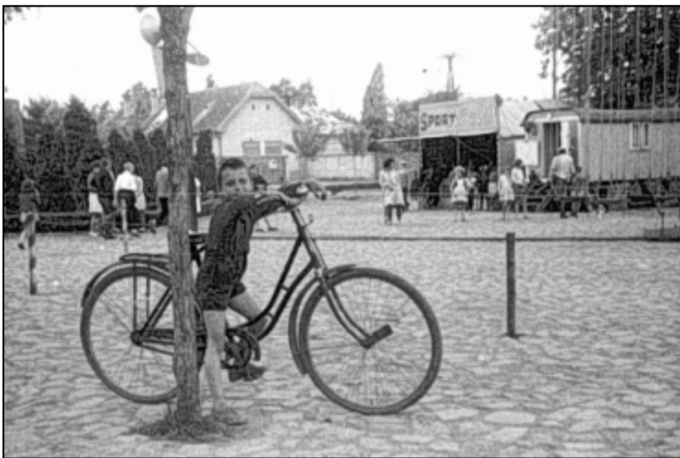
A Piac tér (ma Szent István tér) a' 60-as évek közepén. A kép jobb szélén a fák takarásában ma is a katolikus templom áll.

Az 1930-as években az utca ünnepe volt a kirakodó vásár. A Sarkad közepén, a Kossuth utcán a Polgári Fiúiskolától a Takarékpénztárig, azután a Piac téren (ma Szent István tér) ponyvasátrak sokasága tarkállott. Az aránylag széles Piac téren a sátrak között utcák is sorakoztak. Bennük mind megannyi tarkaság, cifraság csalogatta a báméskodót. Biztosan voltak olyanok is akik költöttek a pénzt, hiszen a vásárlók szépen éltek, „megéltek”. Én az 50 filléres zsebpénzzel gazdagnak éreztem magam és ott tolongtam, ahol „Minden darab 24!” kiáltással a játékarusok kínálták portékájukat. Kisautót, a kerepelőt, a simlábdat, a parafás pisztolyt, a jójót, a káflis pisztolyt és a többi.