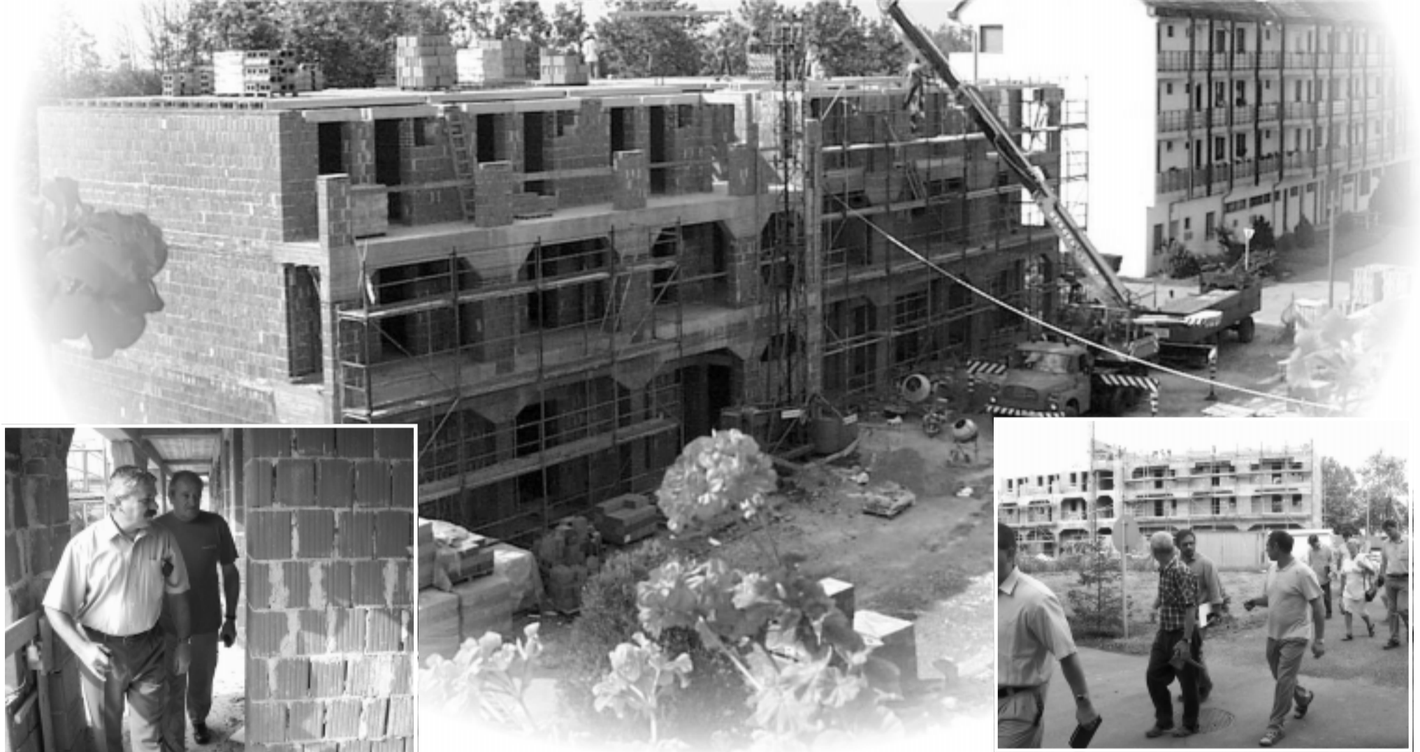
A 123 millió forintos összköltséggel készülő 15 család elhelyezését biztosító lakások és a földszinti szolgáltató sor építése a terveknek megfelelően halad ezért a decemberi átadási határidő tartható. 12 lakás szerkezetkész állapotban van, a földszinti vakolás is elkészült a vízvezeték és az elektromos hálózat kiépítésével együtt. A műszaki ellenőr hibamentesnek üéli az építkezést.

A beruházási szemle során összességében a folyamatban lévő beruházások ütemes, zökkenő- és hibamentes kivitelezési munkáinak lehettek tanúi. Újabb önkormányzati munkapénzsumókat állapíthattak meg önmaguk számára, ami - úgy gondolják - hozzájárul ahhoz, hogy az elindított beruházási folyamatok a város és a lakosság gazdagodására a megfelelő minőségben befejeződjenek. -kas