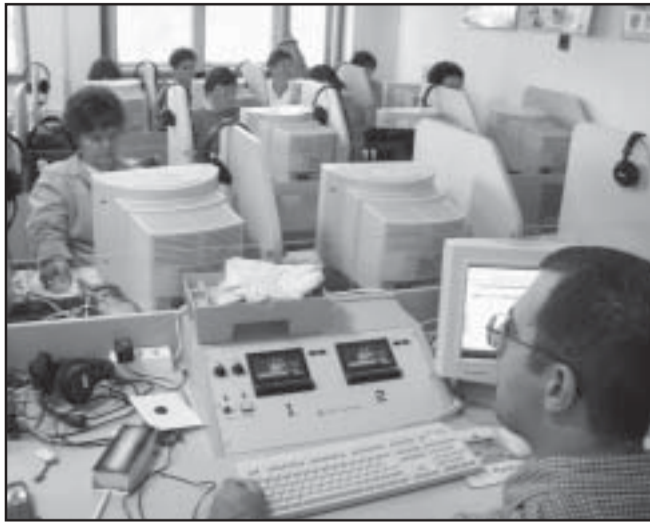
A gimnáziumi számítógépes oktatóterme volt a gyakorlati hely

A Szociális és Családügyi Minisztérium 1999. decemberében indított programjával segítséget kívánt nyújtani a települési önkormányzatoknak a szociális igazgatási tevékenységük korszerűsítéséhez. Minde- nek előtt az informatikai