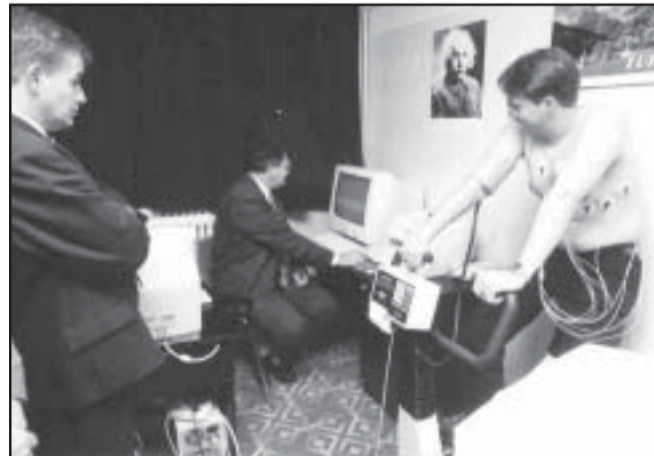
... és a számítógép vezérelt EKG berendezés