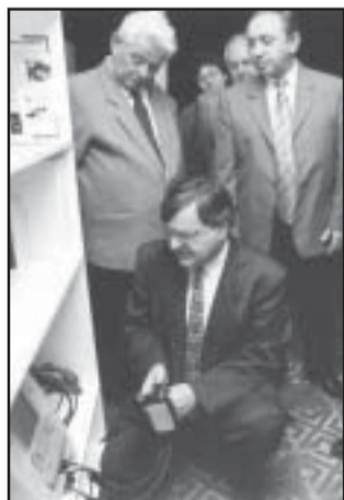
Az újraélesztő készülék...