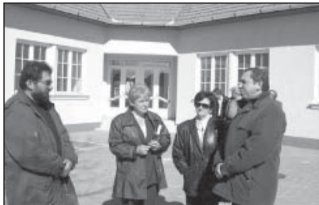
Az átvevők egy csoport az iskola belső udvarán

Március 11-én hiánypótlás nélkül bonyolódott le a műszaki átadás-átvételi eljárás, így nincs akadálya annak, hogy 2002. március