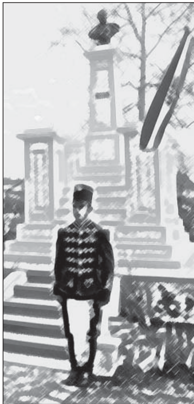
Sarkadon 100 évvel ezelőtt avatták fel Kossuth Lajos mellszobrát a mai Kossuth-kertben

szíve előtt idegen nagyságok hajtottak fejet.