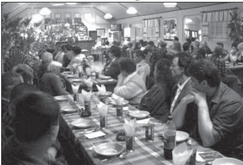
A véradók családtagjaik körében ünnepeltek