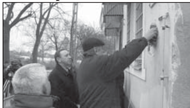
Az első koszorút a város vezetése helyezte el