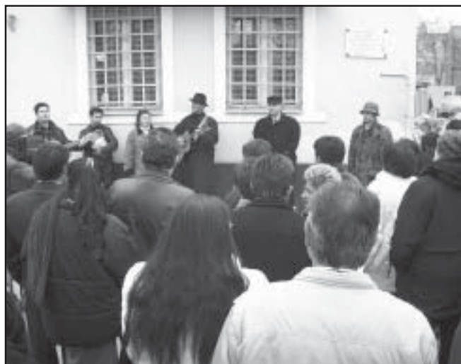
Felcsendültek a Cigány Himnusz hangjai is