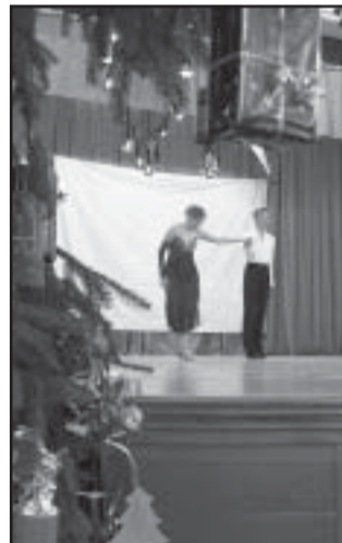
Versenyáncosok a színpadon