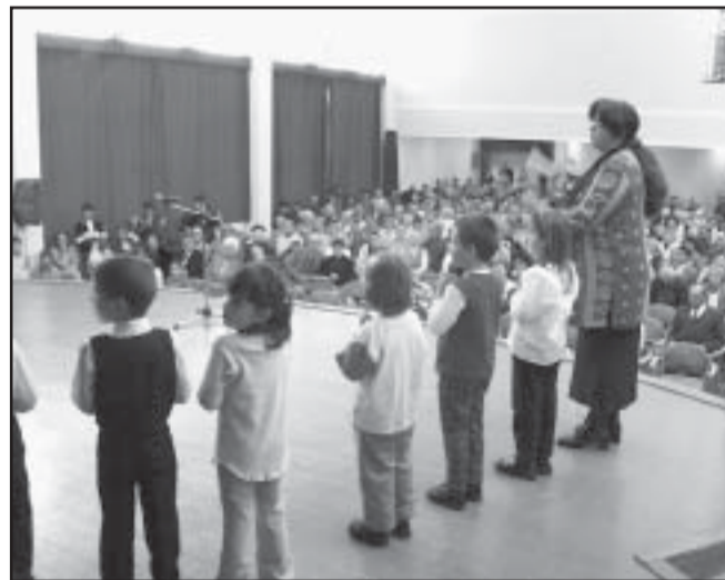
Az óvodások műsora