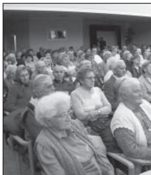
Zsúfolásig telt a kultúrház nagyterme