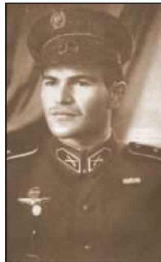
Ejtőernyős századosként Moszkvában, a zászlóaljparancsnoki tanfolyamon (1950)