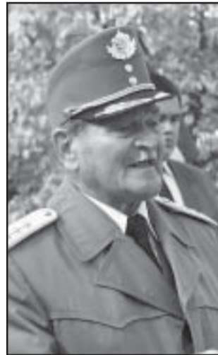
Márton András nyugállományú honvéd altábornagy (Sarkad, 2002. október)