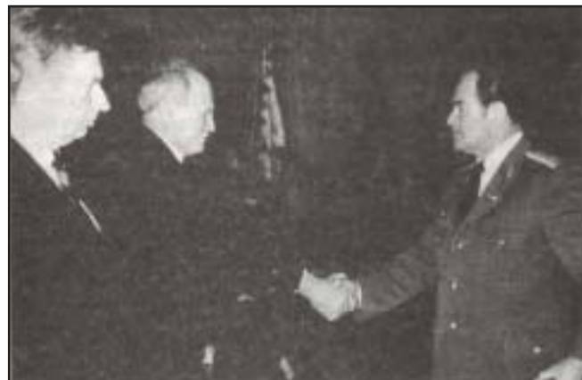
Göncz Árpád köztársasági elnök átadja Márton András vezérőrnagynak az 56-os Emlékérmét (1991. október 23.)