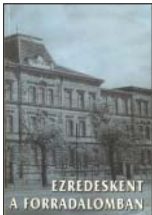
A könyv borítóján a Z M katonai Akadémia épülete

Sarkadon jártam, majd Cegléden, a Kossuth Lajos Reál-gimnáziumban tanultam. A ceglédi gimnáziumi évek után a Duna-melléki Református Tanítóképzőben orgonista és kántortanítói oklevelet szereztem. Aztán öt szemesztert elvégeztem a budapesti József Nádor Műszaki és Gazdaságtudományi Egyetem közgazdasági szaktanárképző szakán. Egyébként az ötös szám végig kísért az életemet.