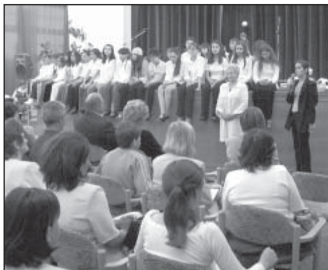
A megnyitó percei

„Boldogan állok itt, mert tudom, hogy csodálatos est lesz. A Szülőknek azért, mert gyermekeiket láthatják. A pedagógusoknak, mert részei a felkészítésnek és a gyermekeiknek, mert bemutatathatják, mit tudnak” — mondta