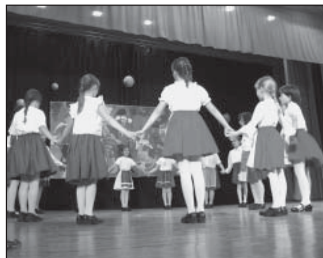
Színpadon a néptáncosok