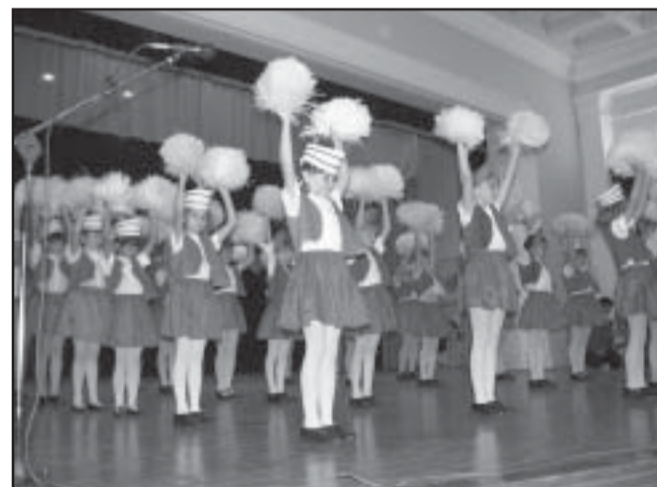
A majorette csoport bemutatója