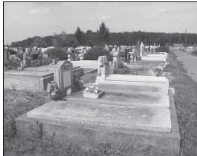
A Körösháti temető ezen része az Újteleki Református Egyház tulajdona

- felhív a jogszabályokban és a temető szabályzatban foglalt rendelkezések betartására - szabálysértési eljárást (Folytatás a 2. oldalon)