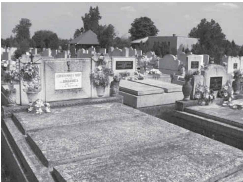
A Szigeti temető teljes mértékben a Belvárosi Református Egyház tulajdona