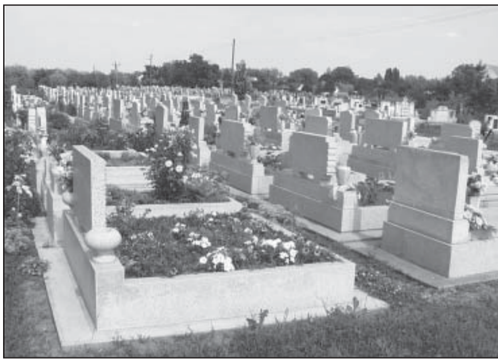
Az önkormányzat tulajdonában van a Körösháti temető ezen része

Ezzel egy időben meghívásos pályázat keretében 5 gazdálkodó szervezetet kerestünk meg testületi döntés alapján felhívva őket arra, tegyenek ajánlatot az önkormányzati tulajdonban lévő