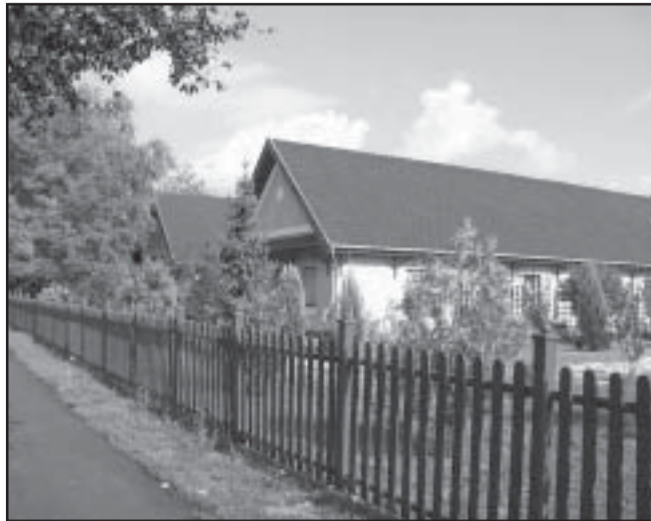
Ma az otthon gondozott kert és park övezi