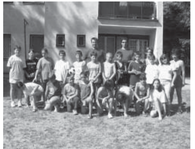
A csapat az üdülő udvarán

Ismét eltelt egy tanév és újra eltelt a táborozás a Városerdőn. A Bartók Béla Művelődési Központ és Könyvtár által szervezett Olvasótáborban 20 gyermek és 3 felnőtt tölthettek együtt egy felejthetetlen hetet, akik talán még a fáradalmakat pihenik, vagy már egy másik táborban szorgoskodnak.