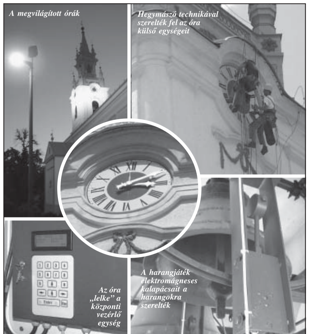
Az óra „lelke” a központi vezérlő egység