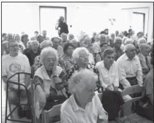
Az otthon lakói