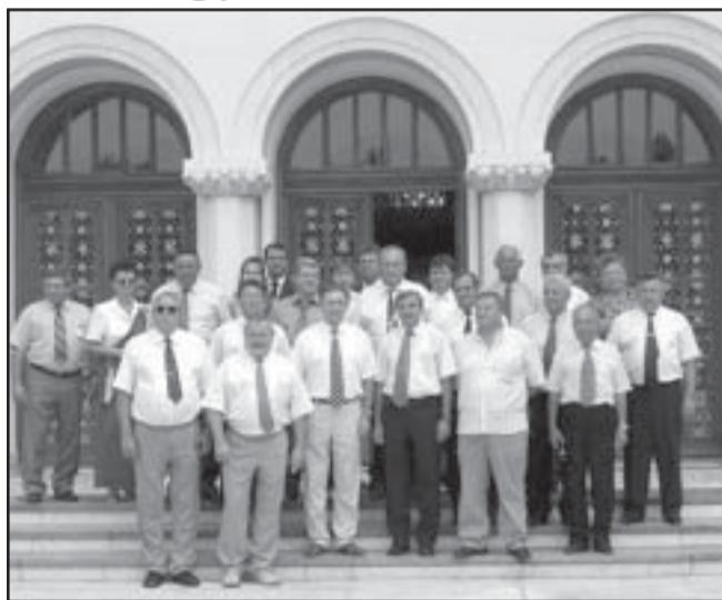
A snagovi palota előtt a sarkadi delegáció

Magyarország településeinek jelentős része tart fenn és ápol testvértelepülési kapcsolatokat más országbeli városokkal és községekkel. Ez egy nemzetközileg kialakult gyakorlat, melynek lényege egymás életének megismerése, a népek barátságának erősítése, és a kölcsönös előnyökre alapozott együttműködés kialakítása az élet minden területén. Ennek szellemében az 1992. augusztus 20-án a romániai Nagyszalonta városával létre hívott, máig is gyümölcsöző testvértársi együttműködés fenntartásával párhuzamosan Sarkád városa is egy újabb „testvérré” talált.