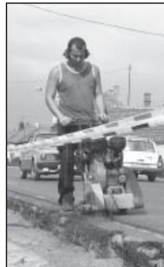
A strabagosok aszfaltvágója „átszabja” az út szélét

→ Az úttal párhuzamos parkolók épülnek az 1. Sz. Általános Iskola előtt (kb. 6-7 kocsihely), a Kossuth utcai óvoda forgalmának bonyolításához a bútorbolt felől (2-3 autó) és saját forrásból támogatottan a Szikra műszaki bolt előtt.