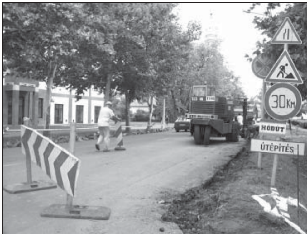
A HÓDÚT „szakaszán” egyelőre a régi útszegélyt szedik fel

Tehát az átmenő forgalmi út két végső szakasza (Gyulai