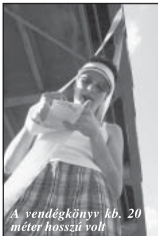
A vendégkönyv kb. 20 méter hosszú volt