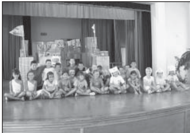
A „napközisek” a papírvár előtt