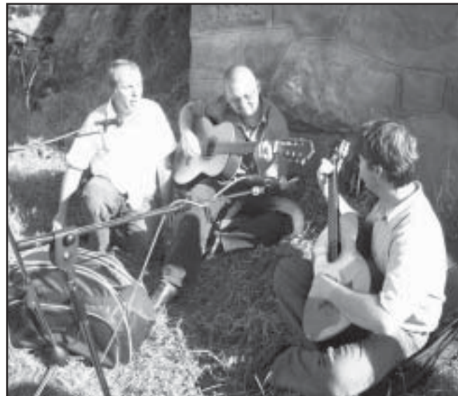
A vésztőiek zenés műsort adtak Szélrózsa címmel